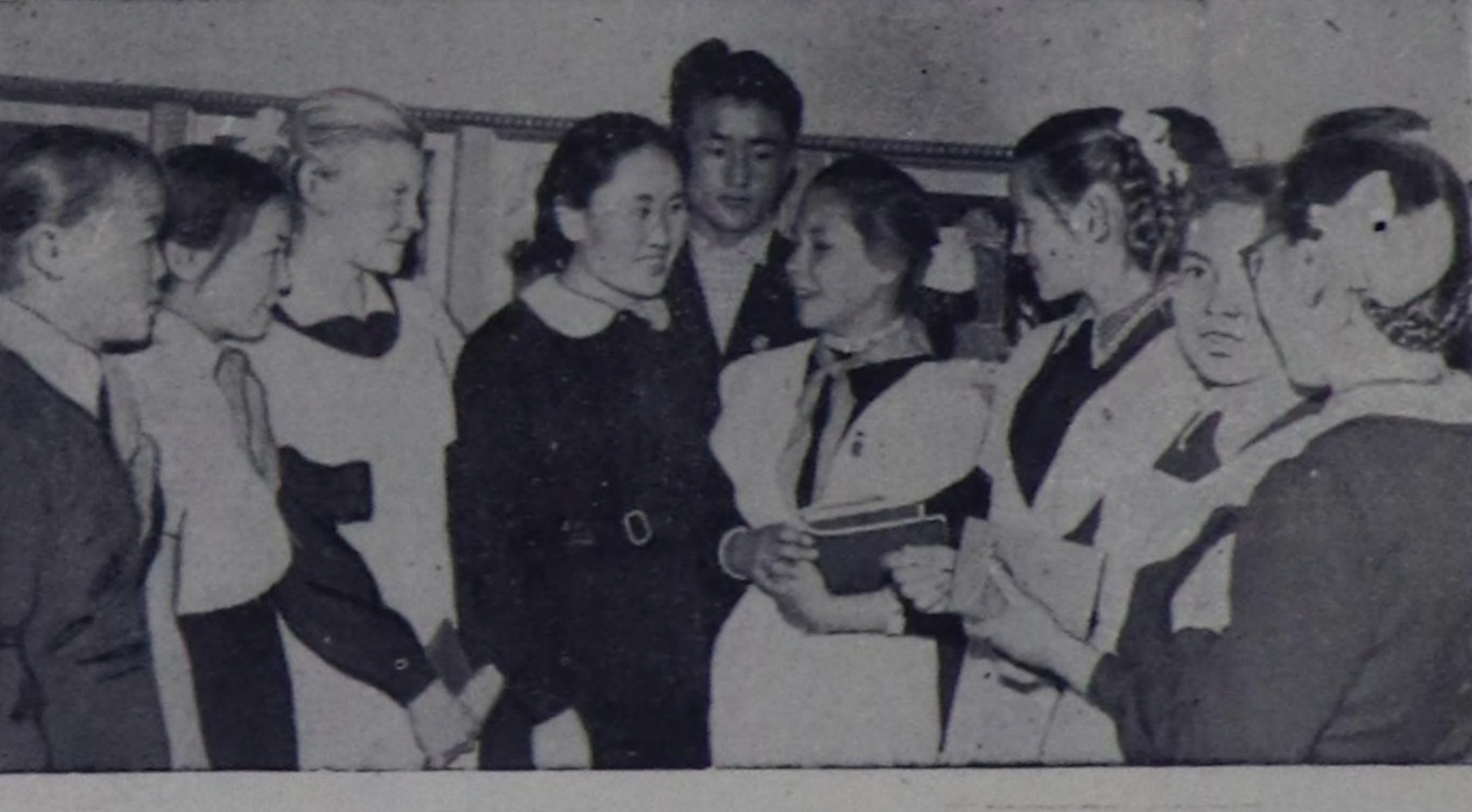
Чурунта: слөттүн бөлүк киржикчилери.