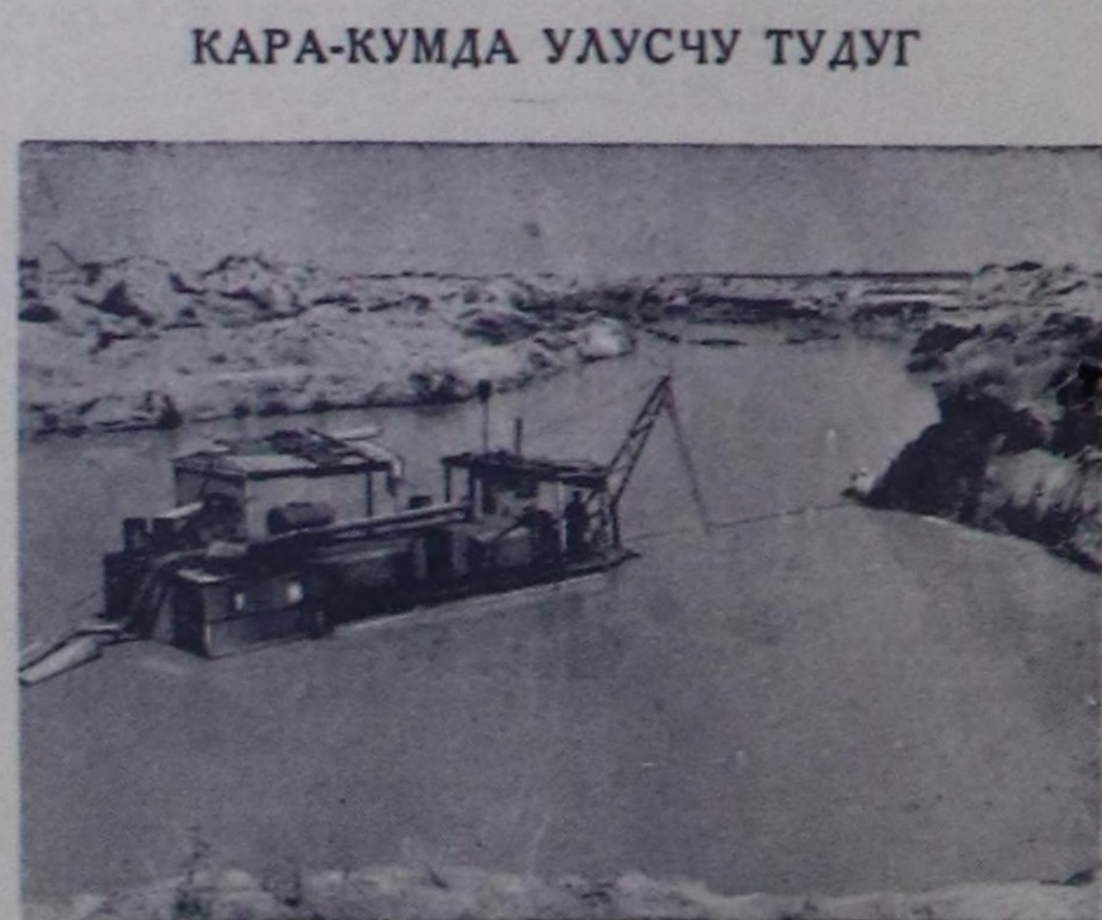
Туркмен ССР. Мургаб биле Теджеб хемнериниң аразында элевинерде Кара-Кум сугтарында каналынын ийги элевиниң тудуу калгарган. Бо чугула тудууну улусчу тудуп деп чарлаан. 139 километр узун дуртук каналынын ийги элевиниң чер ажылдарының кемчөөли 21 миллион кубометр болуп турар.

Ш. КАНДАН, облкуксомунуц улут инструктору.