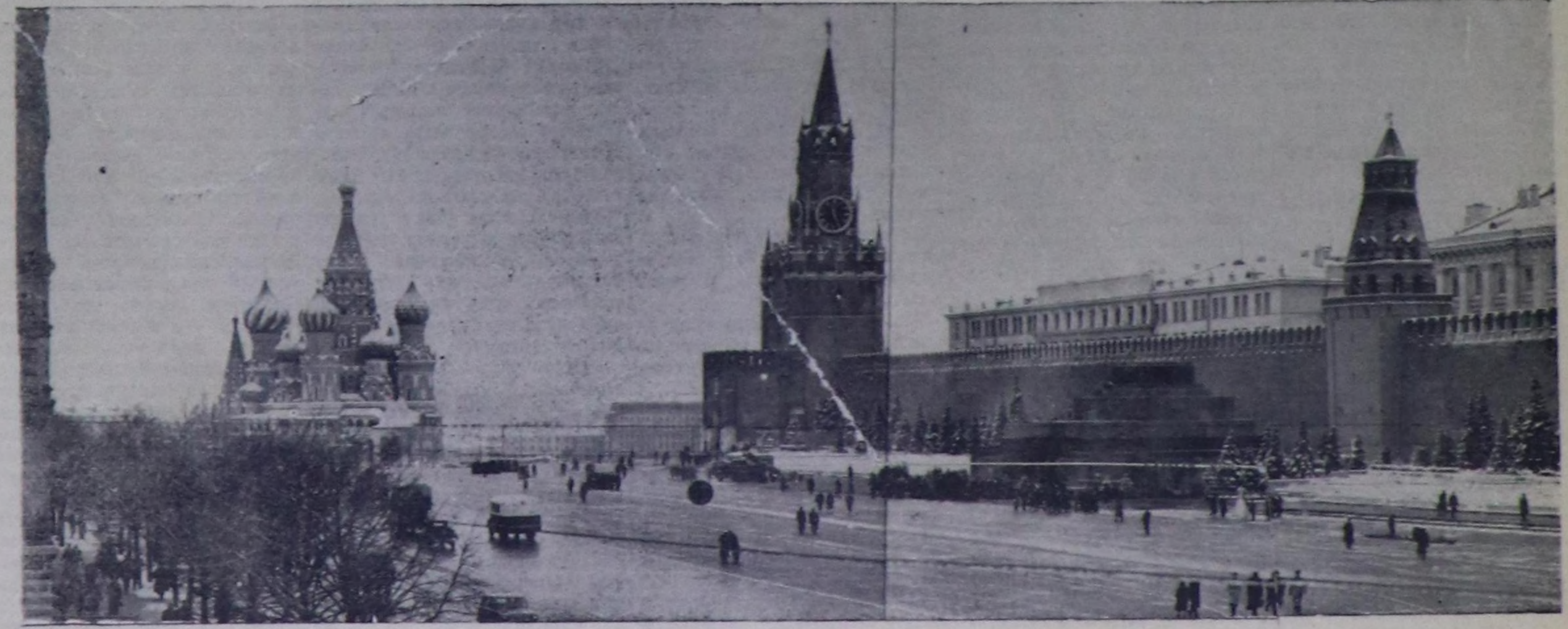
Москва, Кызыл шөл.

ССРЭ-ниң Камгалал Министри Совет Эвилелиниң Маршалы Р. МАЛИНОВСКИЙ.