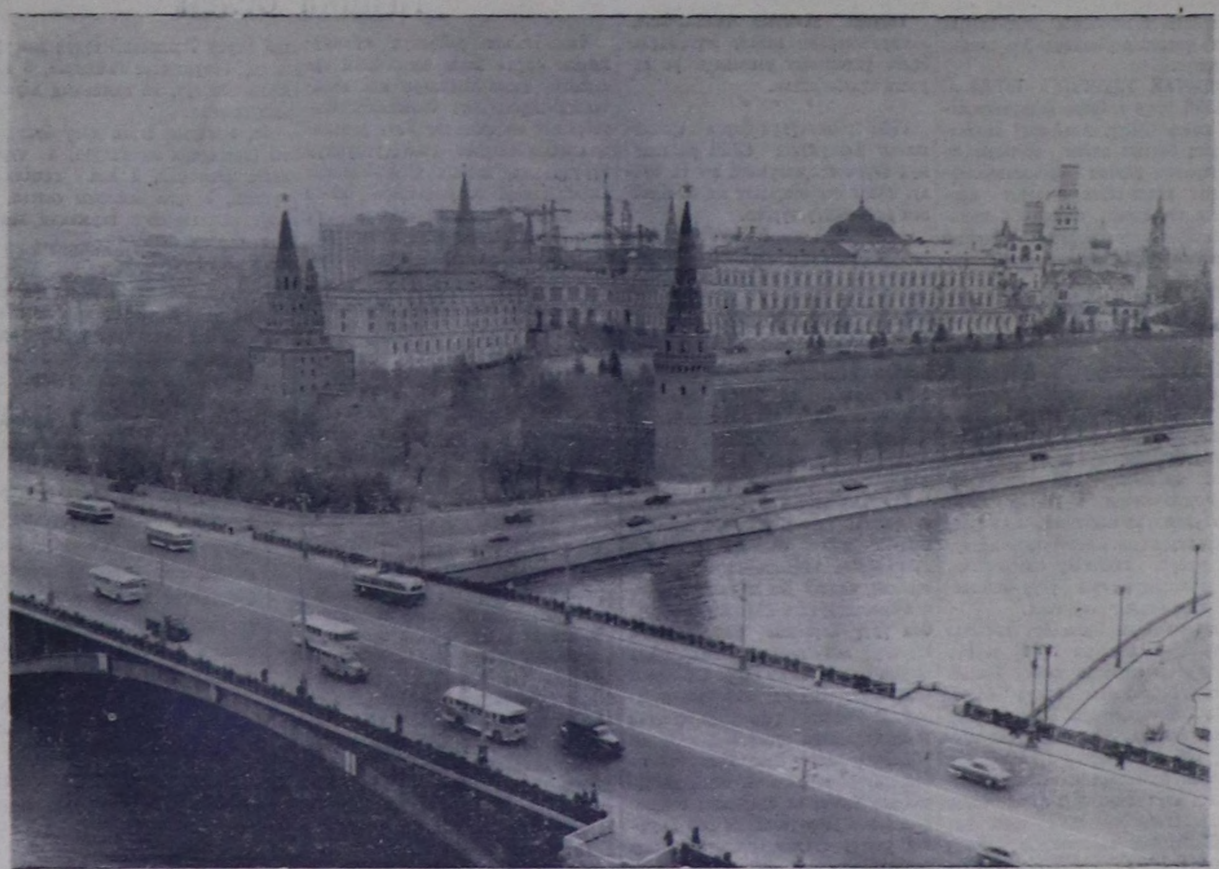
Москва. Улуг даш көвүрүгүнүн талазындан Кремльдин шийчизи.