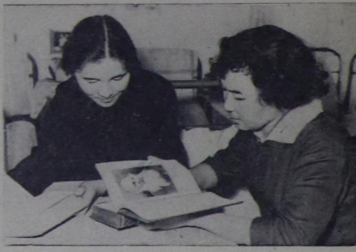
Л. Н. Толстойнун чогаалдарын кижини бүгү улуг хандыкшы-биле номчуп турар.