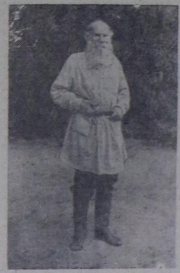
Л. Н. Толстой. Ясная Поляна. 1903 ч.

Тарааны, ээтти, сүтү, картофельди, ногаалары болгаш өске-лаа продуктулары бүүдүрери болгаш күүнелери сазарын бүүдүрери талазы-биле чаа-чаа чедишкениниң болурун В. И. Ленин аттыг көдөз амыл-агы артыкчылары колхозчуларына Н. С. Хрущев күзүн.