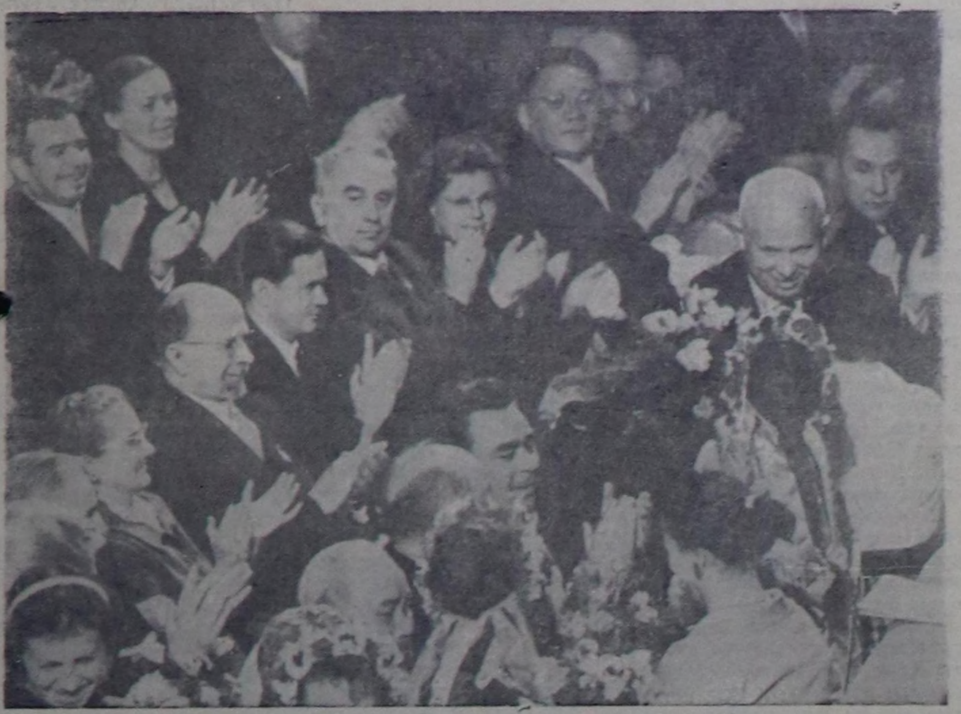
МОСКВА. УССР-ниң Т. Шевченко аттыг опера болгаш балет театры ноябрь 12-де ССР-ниң Күрүнениң академиян улуз театрына Г. Майбороданың «Арсенал» деп операны көргүскен. Чурукта: балетти көргүскениниң соода. Совет Эвилелиниң партия болгаш чак ууртукчуларына, Улуз Октябрының 43 чыл оюну байырына келген даштык партия-чак төлөөлериң кижизининге балетти көргүскениниң соода украин артистерин чектер тыпсы турары.