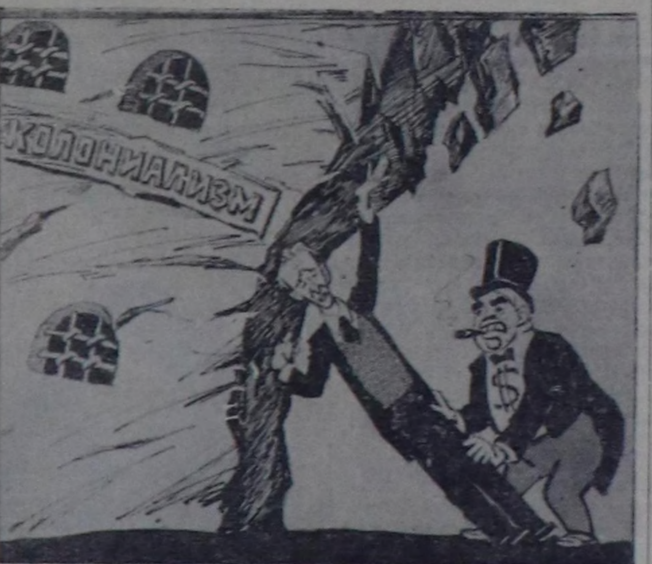
Капиталист: Силерге улуг алдгелерин салып тур бис, кичээш-ле көрүкө, дээрти Хаммаршельд. Чүрү С. Чистяковту. СЭТА-ның фотохроникасы.

КНО-нун чигине секретари Хаммаршельд Аймыл чок чорук Чөвүлеленин шиттирлерин боттагыларда колонизатор-нун туружун элзеш.