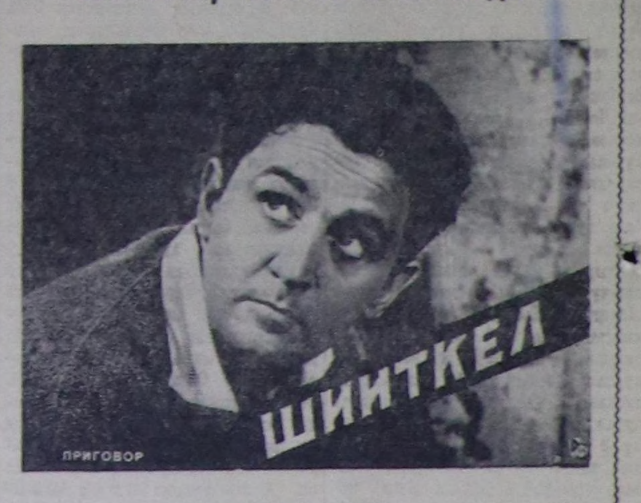
деп кинону көрүңөр.