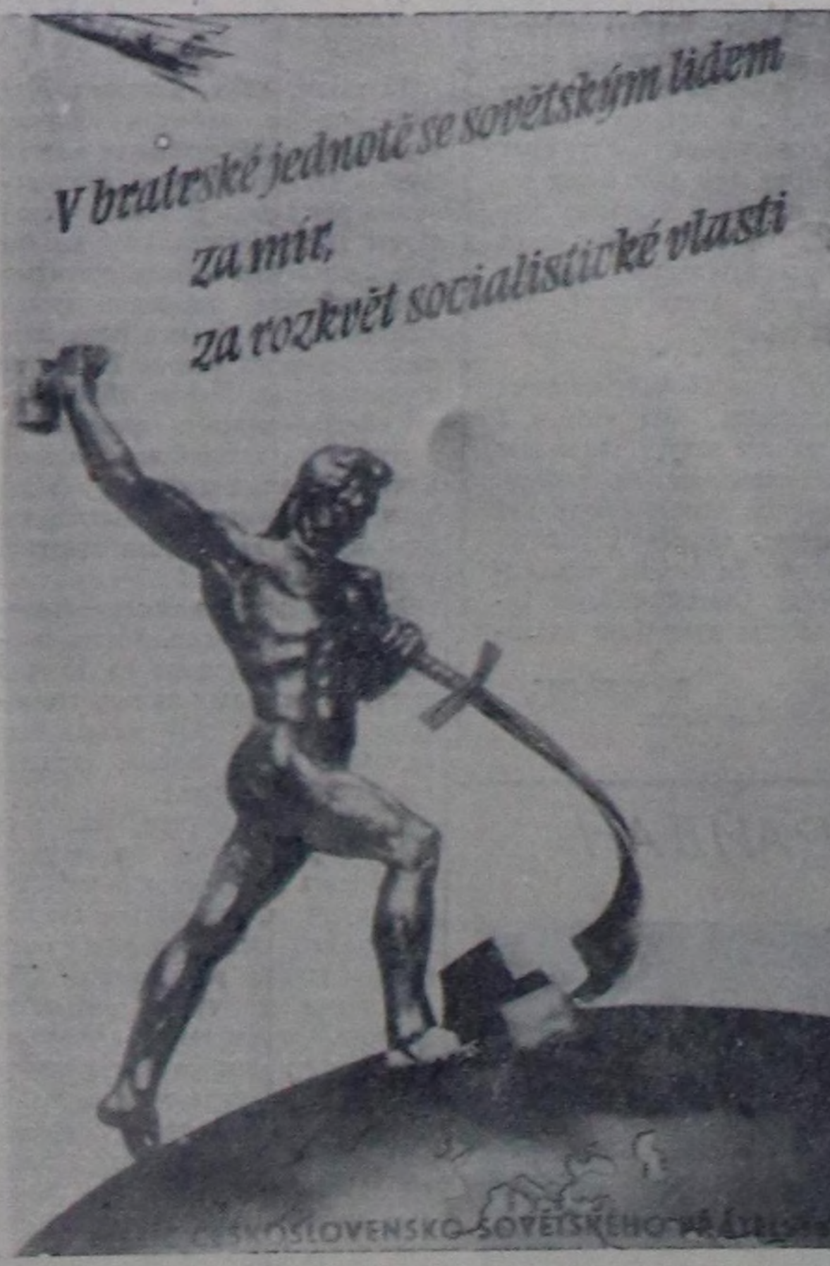
Чехословакиянын Социалисттик Республикасында чехословак-совет найыралдың айы эгелээ. Чоокта чаа чер бамбүрээниң кырында «Селемени андазын кылдыр эде дарганналы» деп скульптураны көргүскөн плакатында партиятын. Бинда бижики: «Совет улус-биле акы-дуңма катты-жып алгыш, тайбыч дээр, социалисттик Төрөн чуртун чектелешкини дээр». А алаанда: «Чехословак-совет найыралдың айы» деп бижээр.

«Алдын Прага» кырынга ижир дүжүтери билек-ле оң куудуңула-ры чүүд-бүүү өнүгү оттар-биле шытынар болгаш ук хоорай улам хайышкынын болуп, хижилер көвүдүй бээр. Эң ылангыч театрлар-же кирер эжиктер чынында дыка хей хижилер чыгып турар. Олар-нын дыка хей чехословак-совет найыралдың айына алдар кылдыр орус классиктерин болгаш совет авторларынң ши баа музыка чөг-галдарын көргүзүп турары ол-дур. Шалпыч айың театр программ-мзы И. Жгановтун «Муса Дал-лыс» деп операсы-биле ажитты-ган. Ону национал театр тургускан.