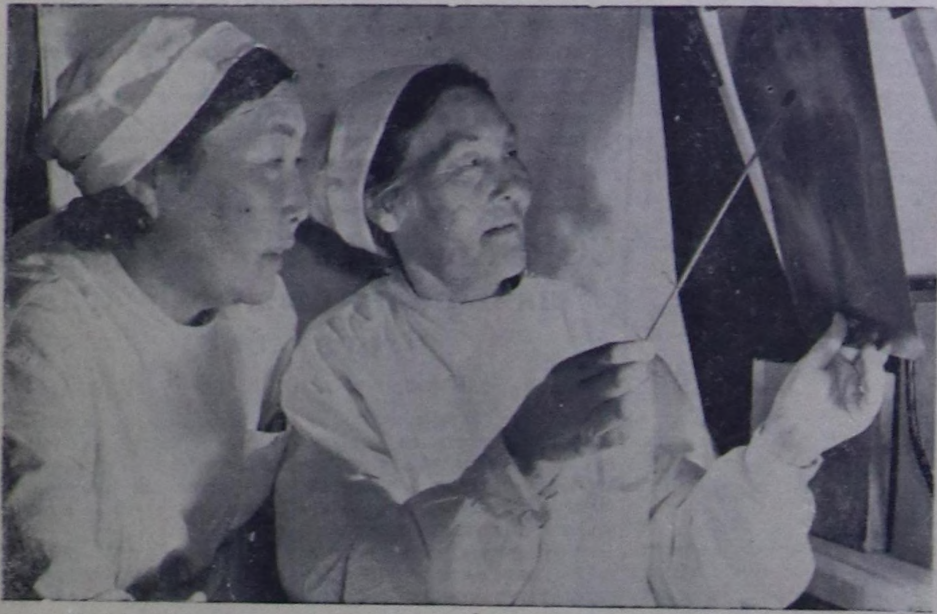
Элиста. 40 чылдарын мурунда Калмыкияга чүгөл 5 эмчилер болгаш 36 эмгелге орунлары санаттын турган, а м Калмыкияда 1000 чыгач эмчилер болгаш ортума медицина аймакчалылары, 56 эмгелдер, 168 фельдшер-акушерка пункттары, 12 санитар-эпидемиологтук станциялар бар.