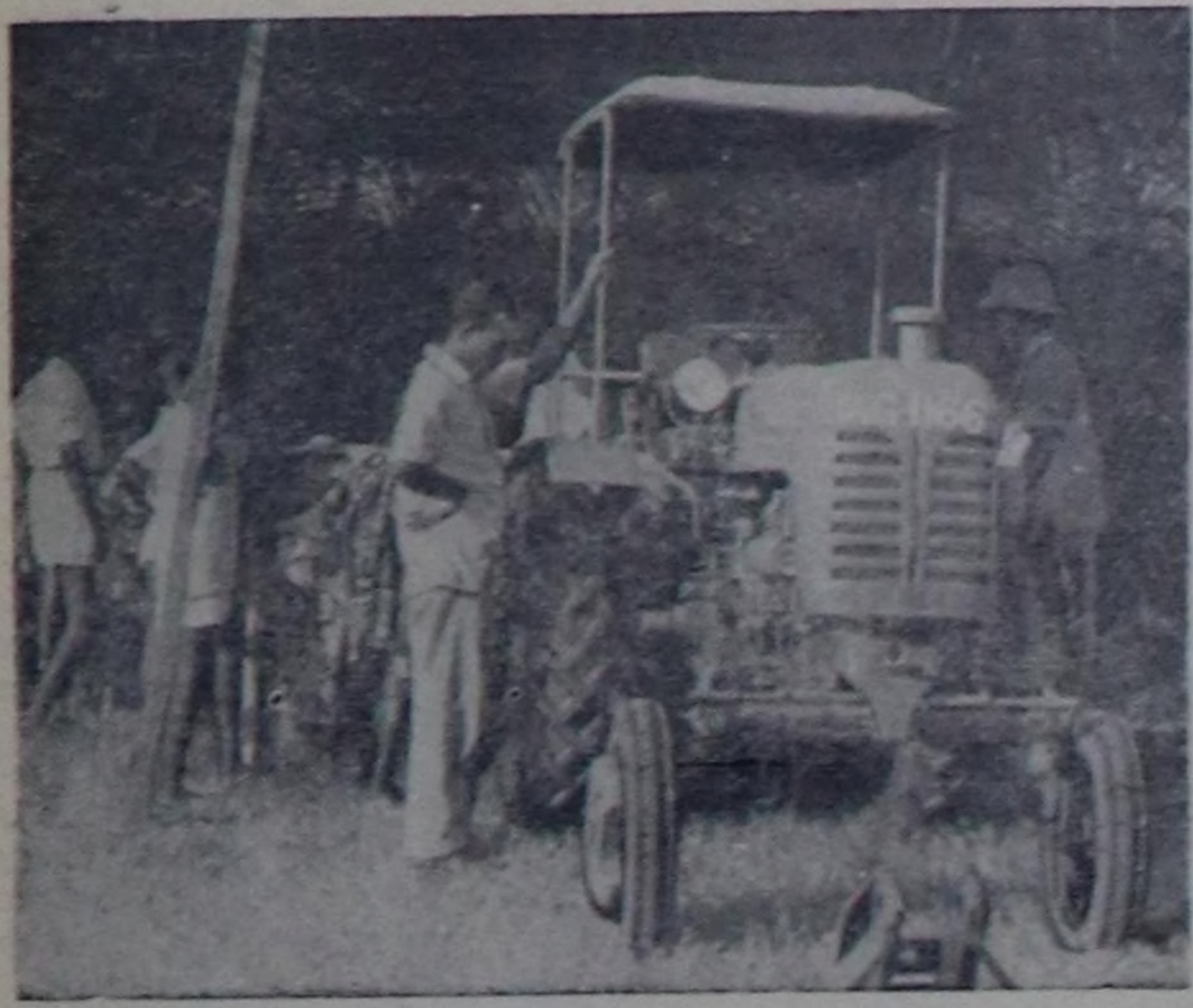
Гана Республика. Аборига (Вольта району). Ук черин аң баштайгы көздө ажил-агый делегезини организастан. Аназ көздө ажил-агый продуктуларын, өми уксаалыг маалдарын, ус-даргаанар кылдыларын, а ол шыкшаш даштыкыда чуул бүү фирмаларын көздө ажил-агый машиналарын делегез. Совет тракторларын