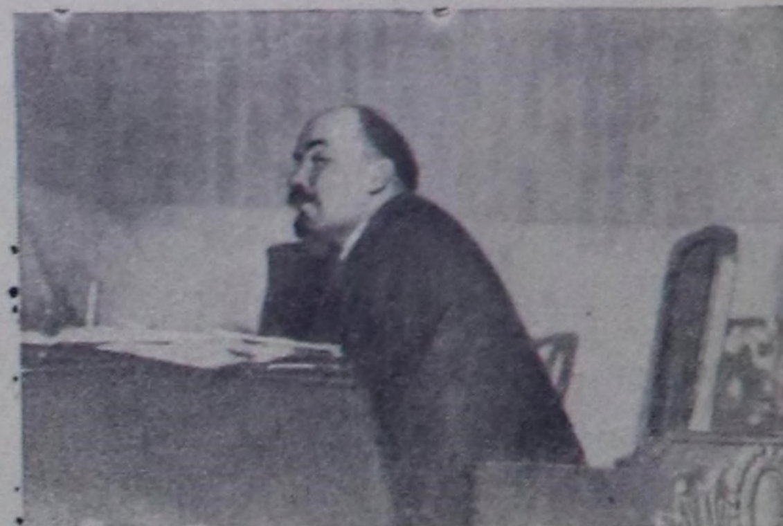
В. И. Ленин РКП (б) ТК-нын хуралында. Москва, Кремль, 1922 чылдын сентябрь 5.

Ленинчи Октябрының тугу кинескөн — Мээң чоңум чалгынынын хериниткен. Ленинниң өөрединиң ачымында Мээң черим мөңгө шагда чырып берген. Хайыралыг Ильичиниң ачымында Курут черим, адым чоңум байып келген, Банчап черде хайныкпай шыдажыр боор! Күшкүлаштыр ужудунар, бодалдарым! Саян, Тандым бедин орта үнүп келдим: Ильичиниң бодалдары ында-мында: Сайзыралда, чогаалдыга, ажыл-иште Иле тола көстүп туру, өөрүнчүм. Бара-Даштың (Ак-Довурак) дашчыларында Хандагайты ыраар-биле эречиткен. Улуг-Хемниң чалгылы танылап, Улуг ажы өлөрүн сорук кирикчи. Бүгүдөни өөрүшкүзү хайныктырган, Бүзүрөдиг бисе берген Улуг Кижээ Болум биле улаушуну ынакшылын Борта черде илеретпес эргем чок тур. Ынчалза-аа Ленинчи үеини Ираап йөрөөр төлөптүг-ле эки сөстү Тоолдардан, ырылардан, чогаалдардан Дораан-на тып азыр-аа белем эвес. Ындыг сөстү чүгө чоңум чүректери, Ильичиге мээң черим ынакшылы Ираап тывар дөзүңгө бүзүредим. Ий-бир сөс тыппыма-аа аас-кежим. Төрөөн черим эң-не чараш чектери Ленинчи туктун дөжөн шимен каастаар. Төрөдөшкөн мээң чоңум чүректери Ленинни мөңгө шагда алгап, йөрөөр. Б. ХӨВӨНМЕЙ.