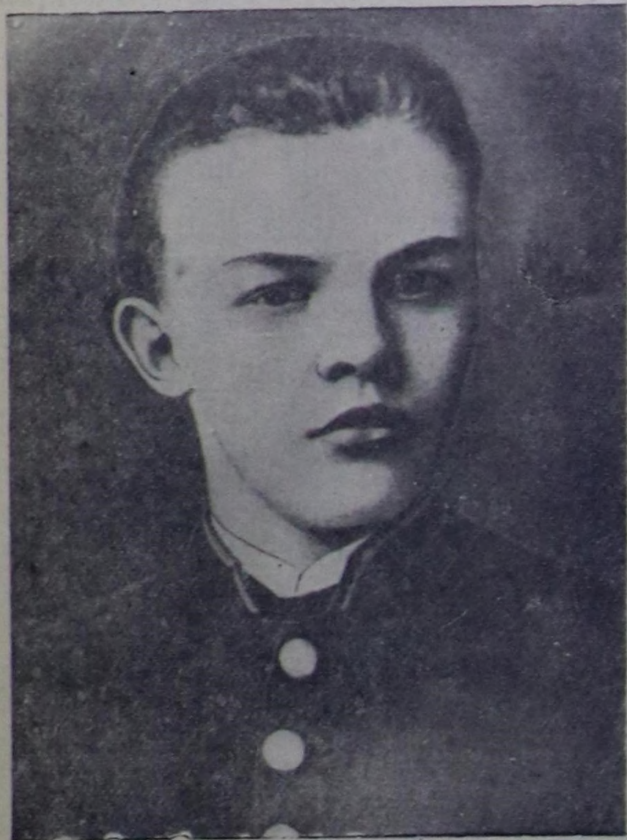
В. И. Ленин (1887 чылда).