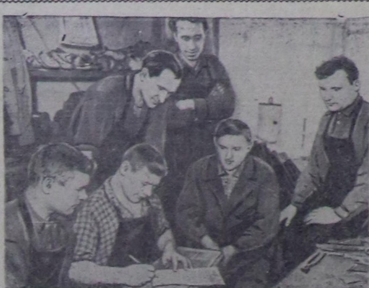
Кызылдын алгы заводунда эш Гавриченкога уурдугач идик дааражыларынчир бригаданы коммунисттик күш-ажылдын бригаданы деп ат дөш демисешпишкан, бедик көргүзүлгелерин чедип ап турар. Бригада хүнүн онаалдын үргүлүчү 140—150 хуу күөсөдип турар.

Бо чылдан эгелеш камгалал төлөвилелринчир түч садып амыр өртөө биле дөңдөөргө, чикке-биле дүжүтүң өртөөнчир 40 хуузуң депчеленге доктаатынган. Ынчаарга дүжүтүң кайда-ла ортумуктан өрү болур, мында 1 гага камгалал төлөвилелинчир өртөө бедик кылдыр доктаатынган. Чижээ, бедик дүжүтүң ап турар Чаа-Хөл районга 1 га кызыл-тастың камгалал өртөө—500 рубль кемчээлге, а чангыс дүжүтүң ап турар Тес-Хем районга—чүтлө 160 рубль кемчээлге доктаатынган.