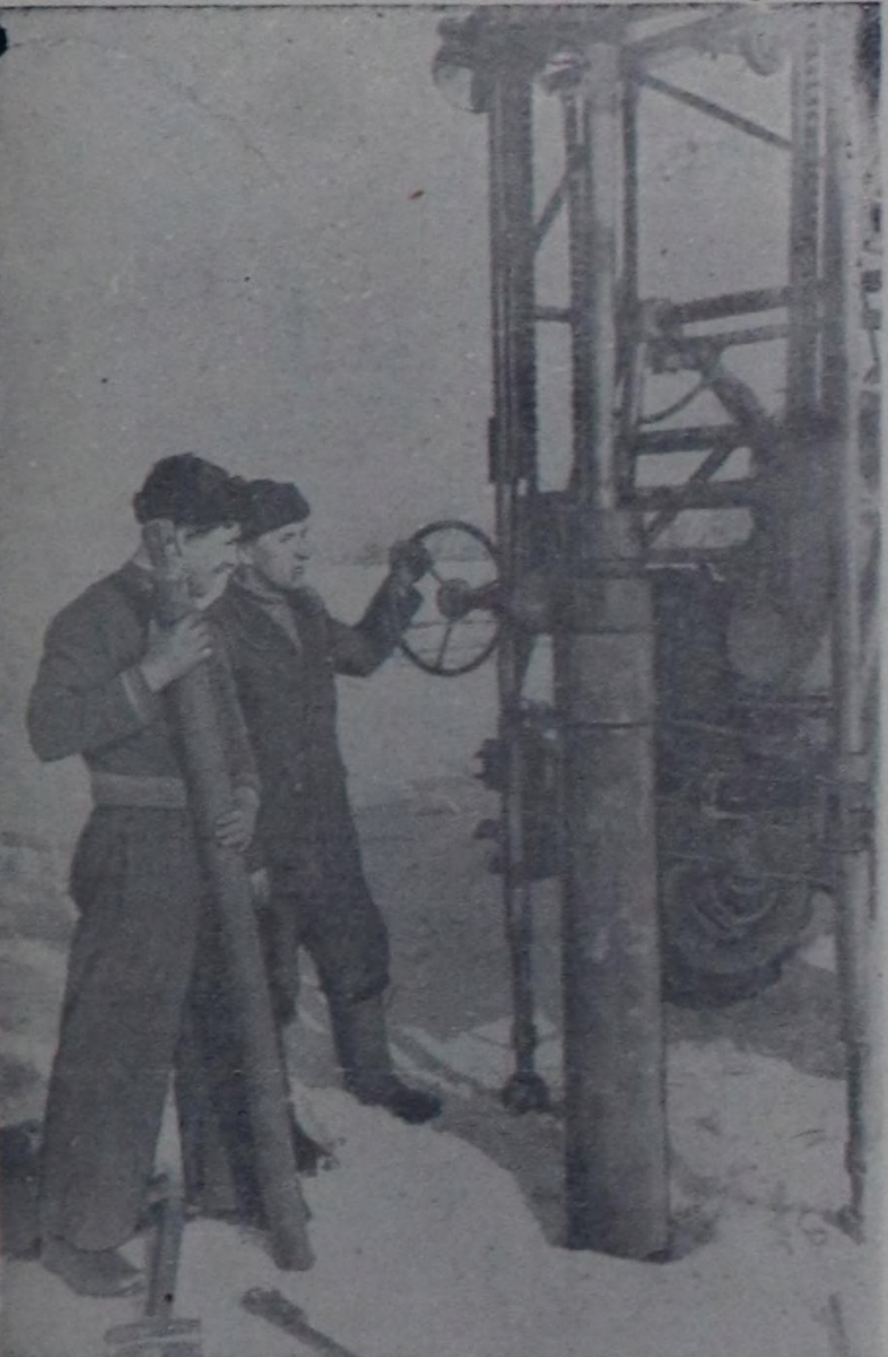
Часкы болгаш кысқы үелерде Улуг-Хемни Кызыл чогуундан кечери бергедей бээр. Оон-биле кады хеминч ол чарында чуртталга сууру, бүдүрүлге чөдөрлөр калбарып турар. Инчанга хеминч кечир көвүрүг тулар сорулганы салып турар болгаш ам инда көвүрүг тулар черин шимчелдөөн чорудуп турар. Ол ажыды Новосибирскинде төлөвилел институтунун инженер-геологун бөлүк чорудуп турар.

Чурукта: көвүрүг тулар черин шимчелде турары.