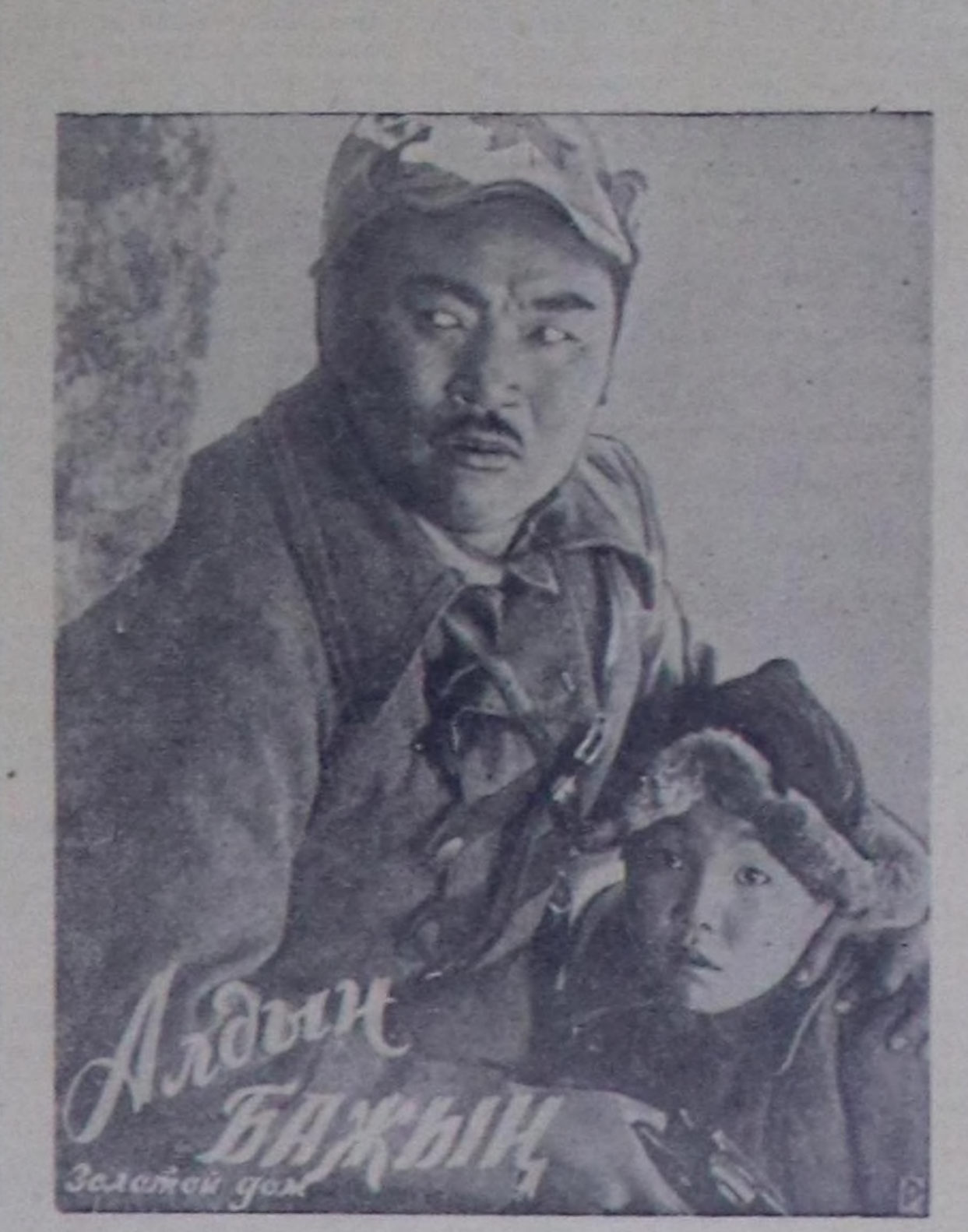
Алдын Бажын. Залгайың дол деп кинону көрүңер.

дүк талазындан эмвелелерге чыдаа көргүспей турарын, шип турар тузуларын эргежок чуматалар-биле чөгүр өйи-хандырлай турарын чидишүгүчүлөөнөр.