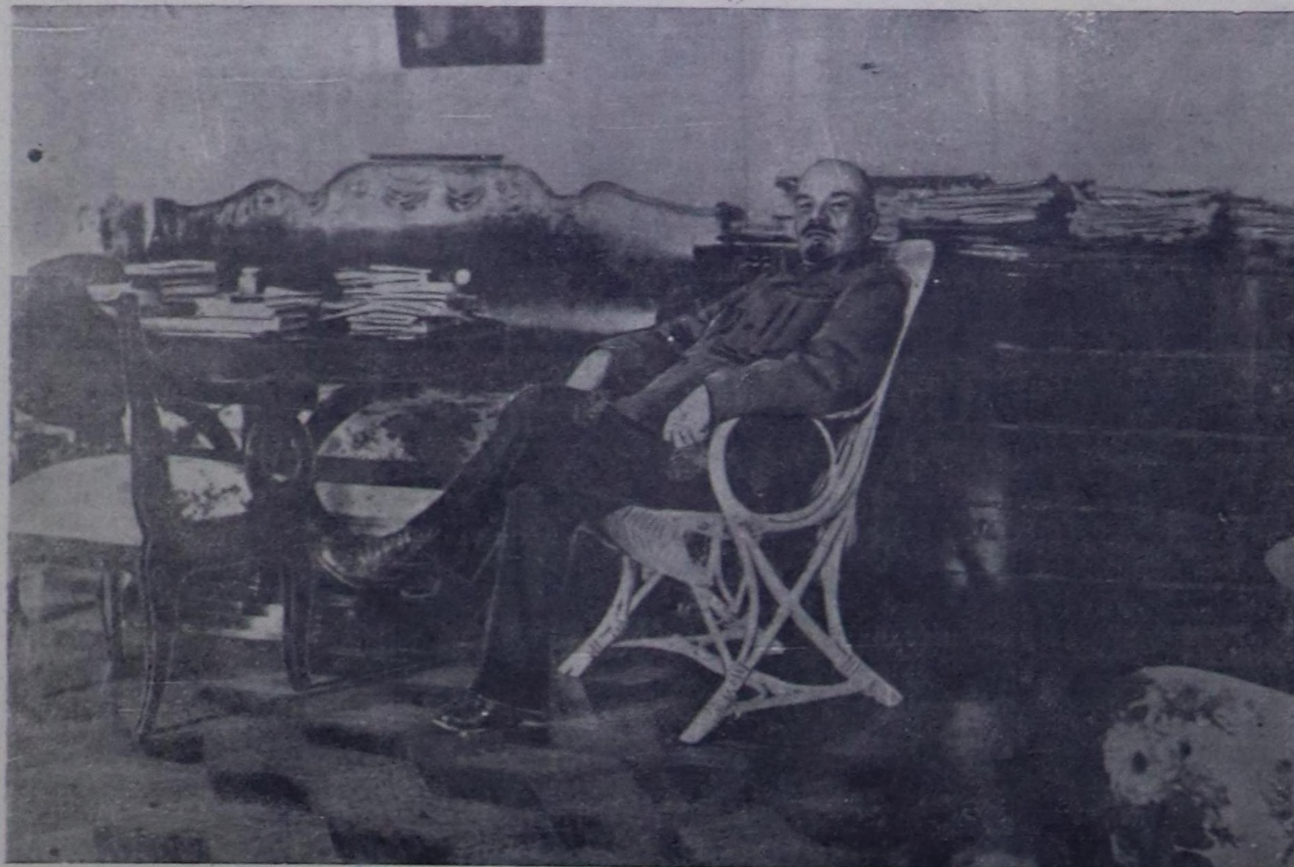
В. И. Ленин Горкиде. 1922 чылдың август-сентябрь.

Социализмден коммунизме өзү киреринин дүрүм сугуар чорудугазы дургедетинген туроп болбайн аан, ыччалажок ол чоруп материалды бугуралугеин бедик хөгжүдөшчө үндөзөлөш болдунар. Өйү келгенде чүвени далаз-биле болдуруп болбас. Иччалажок чедип алдынтан