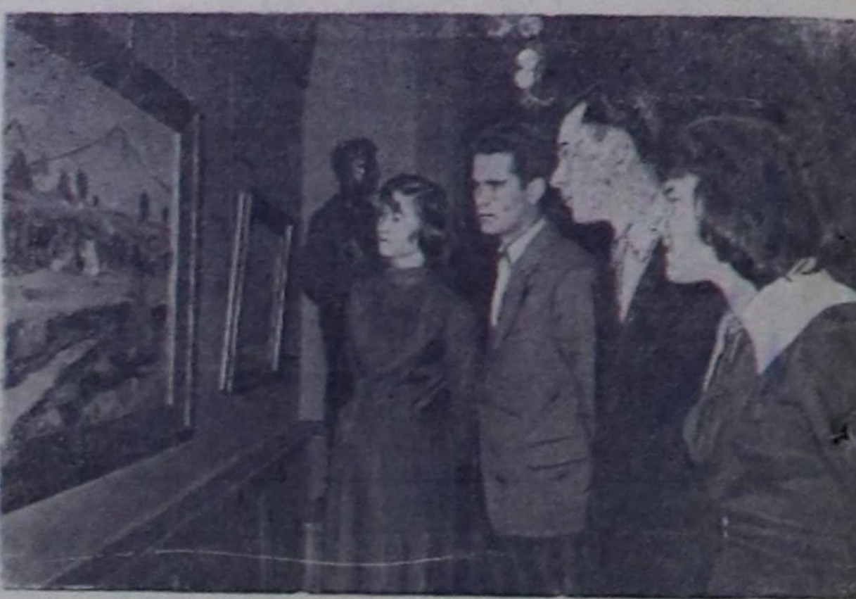
Ленинчи шанналарны тыпсыры-биле депшиткен ажилдар-биле Москванын хөй-нигитин таныжып турар. Е. В. Бутчинин «Селемени анализин дугайында» деп скулптуралын болгаш чурукчу М. С. Сарьянын «Мен Төрөн чүртүм» деп болук чуруктарын Куруениң Третьяковск галереязында дөшөп көргүсөң.