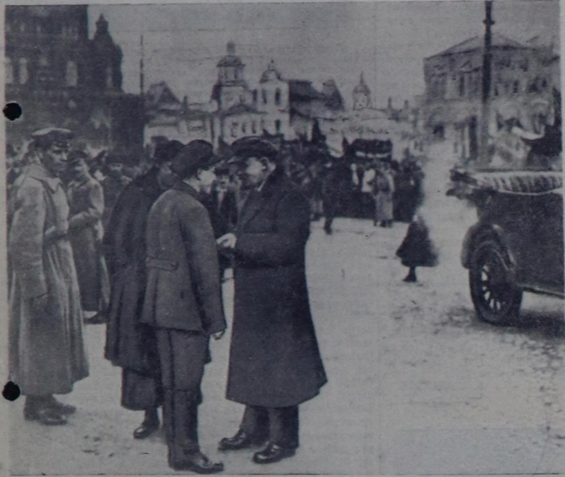
В. И. Ленин Май бирини чыскаалынын үезинде горский-биле Кызыл шөлде чугаалажып тур (1919 РЭП(б)-ниц Москва комитетиниң секретары В. М. Завидный май 1).