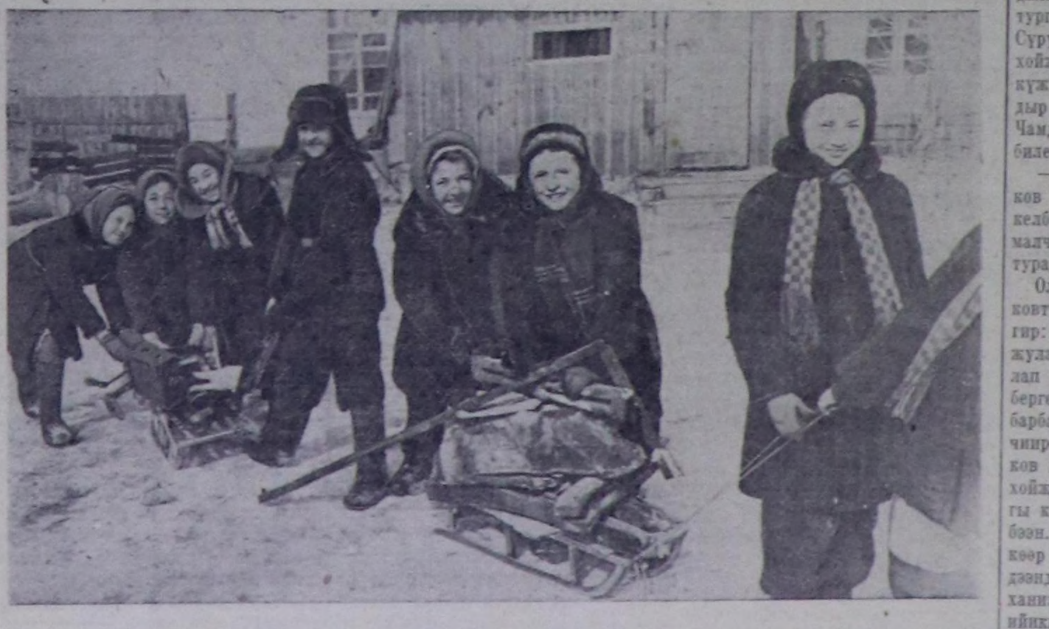
Частын чыгыг үези эгелзери билек Кызылдың шко-ла чыгыг кезек-кезек кыдыр үсүп алган демир-дес айлаан чыгып чоруп турар. Олар чыгып алган чүдөө-дөри школа чанынга өкпөп, оон бир утда дукаап турар-лар. Школалар чыл-бүрүдө-ле ажилгалап үнгөн он-он тонна аны-бүрү демир-дести дукааш, оон тып-кан ашмазы-биле боттарынын школа мастерскаяныга хергеделетинер херекселдер салып алырынга ажилгалап турар. Чурунта: Кызылдың № 1 ортумак школаның 4 «Б» классының өреникчилеринин демир-дести чыгып тура-ры.

Т. КЫЗЫЛ-ООЛ, «Шынык» тускай корреспонденти.