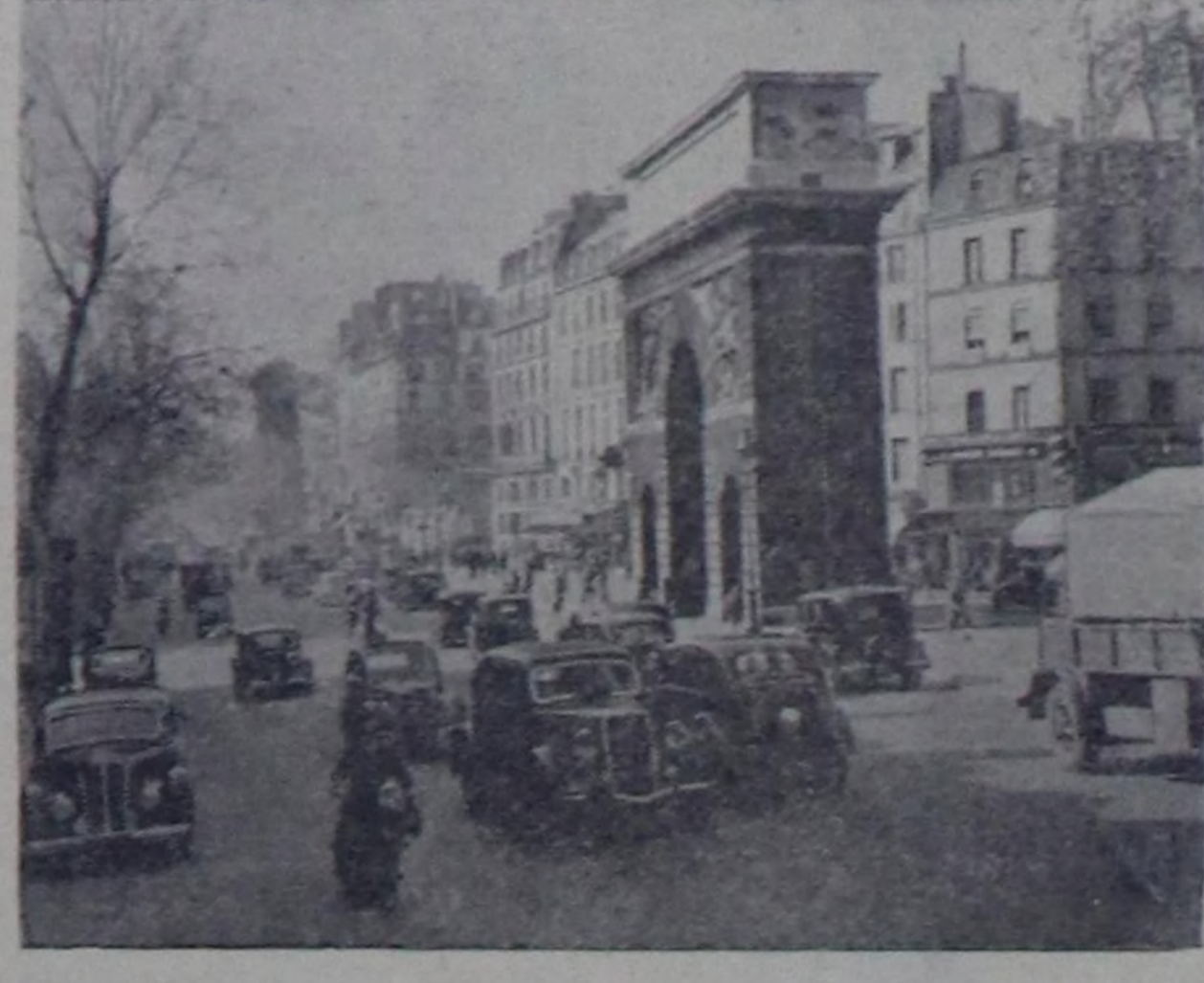
Париж. Улуг Кудумчулар. Сен-Дени дээр хаалга.