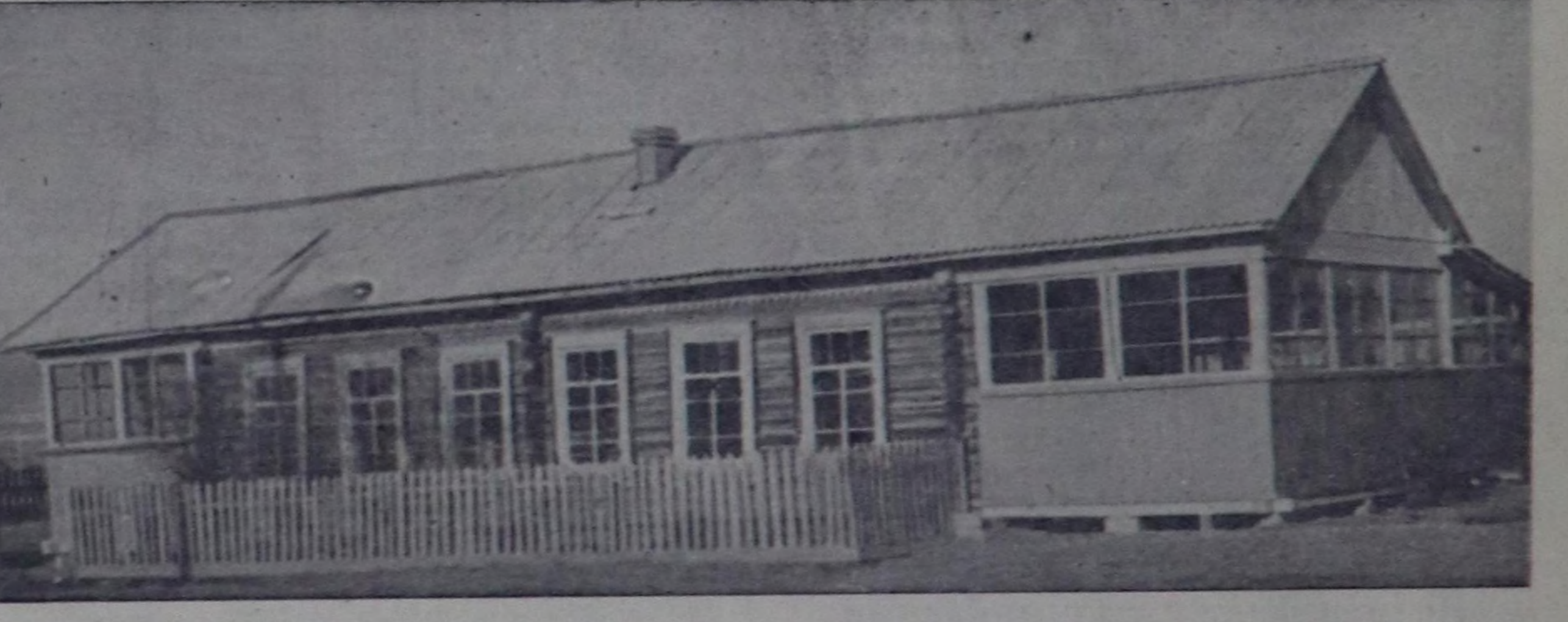
Чоён-Хемчик районун «Коммунистиче орук» колхозунуң тудуулары 60 орунуг уругулар яслинини тудуун доокшам, амыгаллаа кирген. Ясли бажыны таарымчалыг кылдыр туттунган. Оон ийи уюнда 40—40 дөрбел-чин метр шөлдүг веранталар бар. Уругулар чечинер, удуур, ойнаар, дыш-тынар ангы-ангы өрөөлөдүрлөп. Чурукта: амыгаллаа кирген ясли.

дан орулгаларга үндүрүп өванасе. Ол чоруг нитанын ажил-агыйын быжыгларынга артеледер кижигү-нерини күш-ажалын иденкейлиг бол-гаш согуругалын бедирип турар.