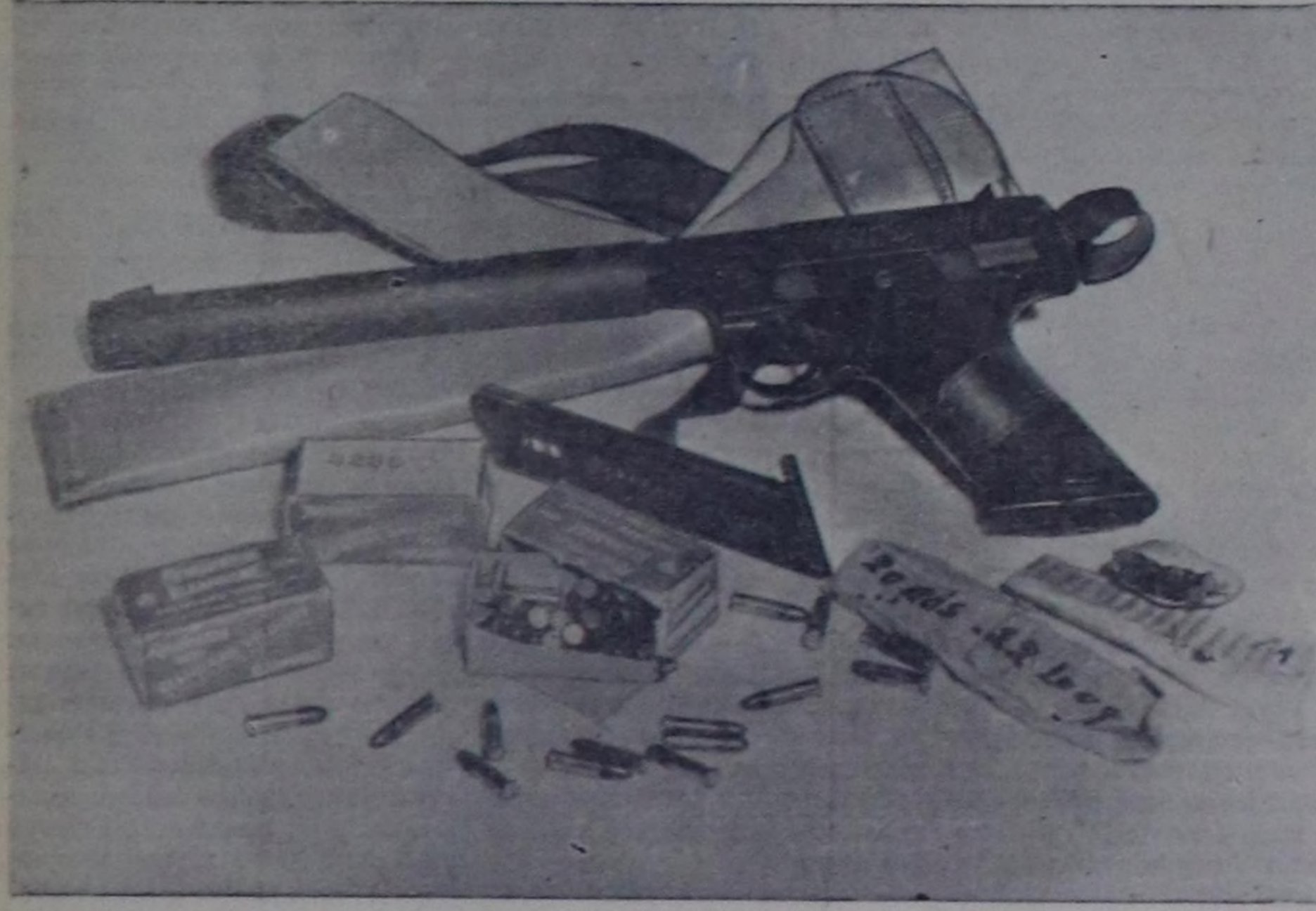
1960 чылдын май 1-де Совет Эвилелинин девискээринге шүрүп кирп келген америк самолётка тывалган чүүлдер. Чурукта: ужудукчуу боову.