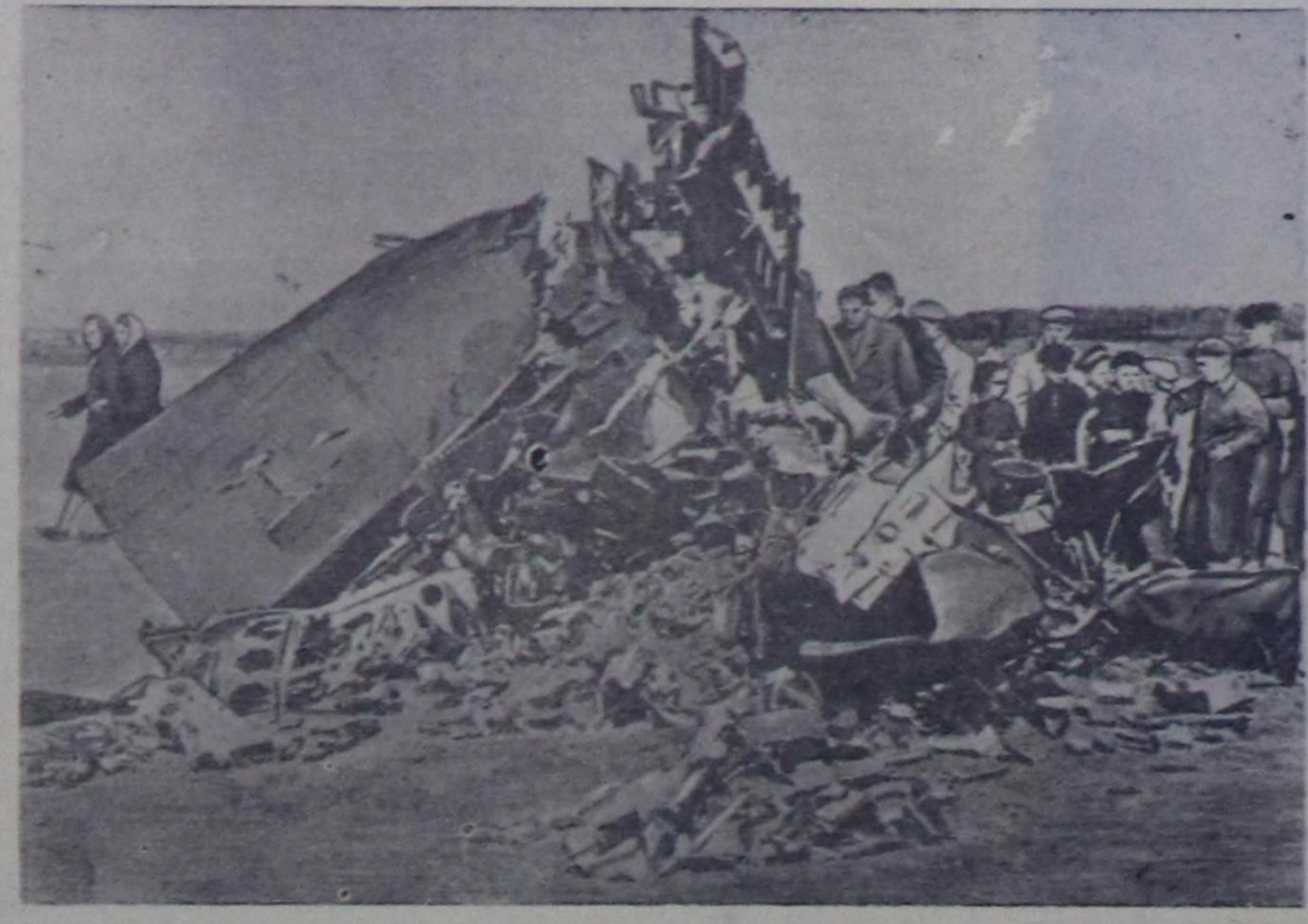
Совет Эвилелинин девискээринге шүрүп кирп келген америк самолёттан артакан чүе бо-дур.