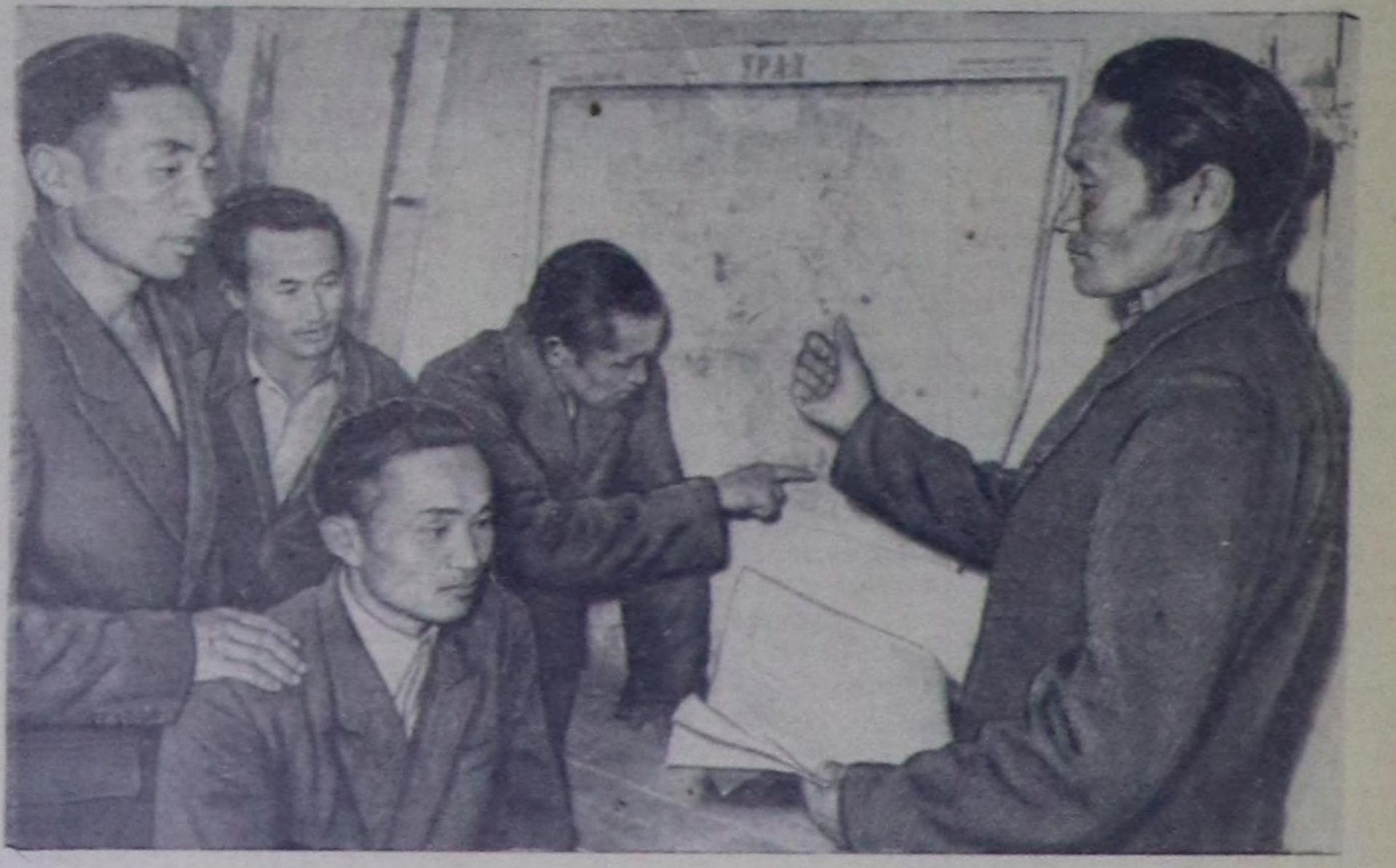
Коммунист күш-ажыл бригадаларымың болгаш шөл- дочыларымыс Бүгү-өвилел чөвүдө хуралымына Н. С. Хрущевтуң чугазымы ажылчы чоннар калбаа-биле та- ныктып турар. Чөөн-Хемчик районуң Ленин аттыг кол- хозунуң чызымыклар бригаданымыс кезигинериң Со- вет чазактын политиказын чагыс үн-биле дегкинишаан, америк агрессорларының өнүк-чөгүзүңгө килеңизеши- ниң илереткенер. Чурукта: америк самолеттуң дүжүр аттырган черин бригаданың кезигинериниң делегей чуруундан көрүп турары.

Украинаның, Белоруссияның, Уз- бекистаның—бүгү совет республи- каларының ажылчы чоннары боттары ның митинглеринде болгаш хура- дарында келир үениң разведчиктери ның шикешкиңин улам кылбартын, лапалдырын, минак Төрөөн чуртувун күчүзү, бүгү делегейге тайбыңны херээ боттарымы эрес-маздырлы күш-ажыл-биле бижылгаарын пар- тиялар болгаш чаааки бүзүрүдип ту- рарлар. (СЭТА).