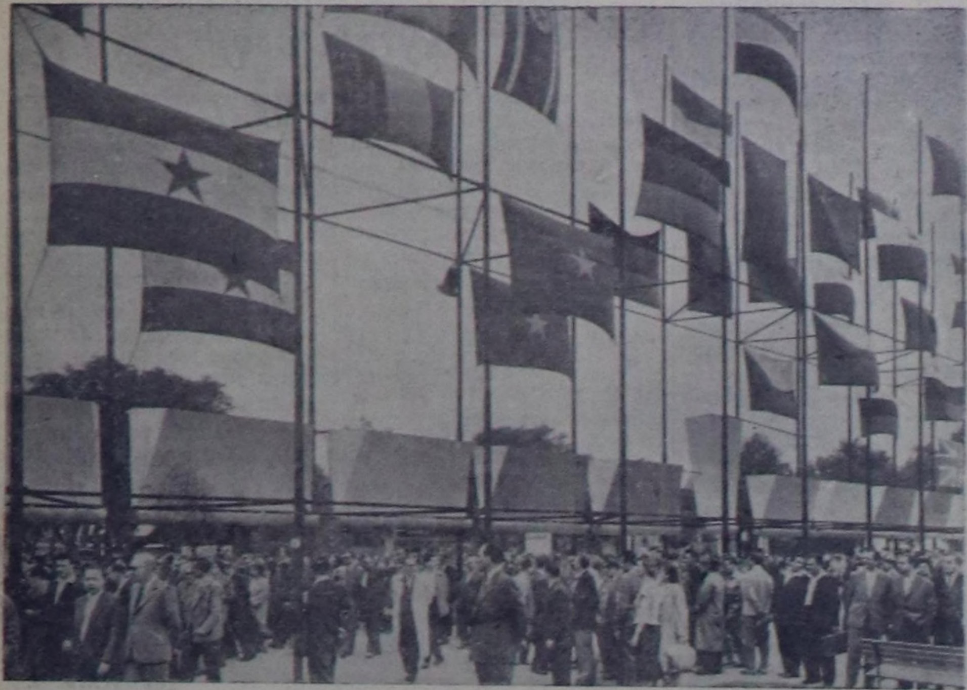
Венгр Улус Республика. Венгр Улус Республиканың найысылымында Будапешттиң үлөтпүр армаркасы амыттыган, апаз ССРЭ-биле кады 19 чурттар киришкенер. Чурутта: армарканың девискээринде.