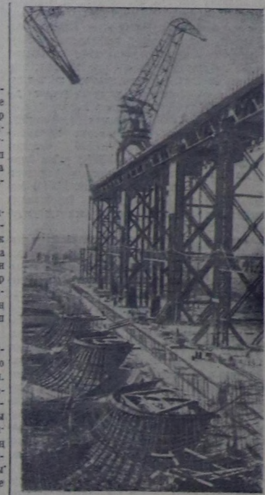
ОБЛАСТЫҢ РАЙОННАРЫНДА МАЛ АЖЫЛЫНЫҢ ПРОДУКТУЛАРЫНЫҢ САДЫП АЛЫШКЫННАРЫНЫҢ ЧАРТЫК ЧЫЛ ХҮЛӨЗГӨЛӨРИНИҢ КҮҮСӨЛДЕЗИ (1960 ч. июль 1-де, хуу-биле).

Мал продукттарын, илалты эгит болгаш дүктү күрүнегө дүжар талазы-биле чартык чыл планын