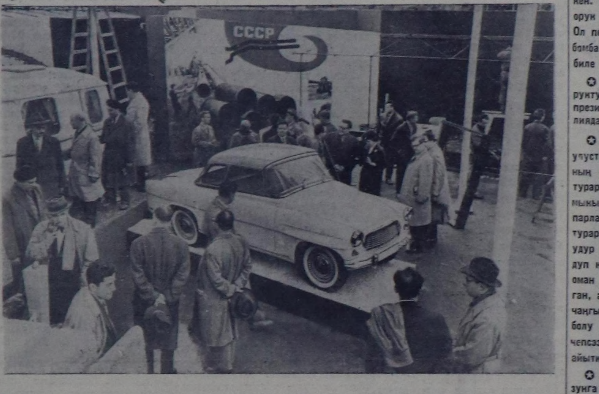
Москва. Совет Армиянын Чехословакияны хостаанын 15 чыл оон таарыштыр Москванын «Сокольники» деп культура болша дыштанылга паркына «Чехословакия 1960 чылда» деп делгеленин организастаан. Анаа он беш чылдын дургузунда чурттуу уллетпүр, эртем, культура хөжүлдэинге база улустун амдылар деннелин бедиригеге чедип алган чедикширерини көргүскен. Чурукта: сөөлү хевирини чехословак автомобильдерин көргүскен черде.