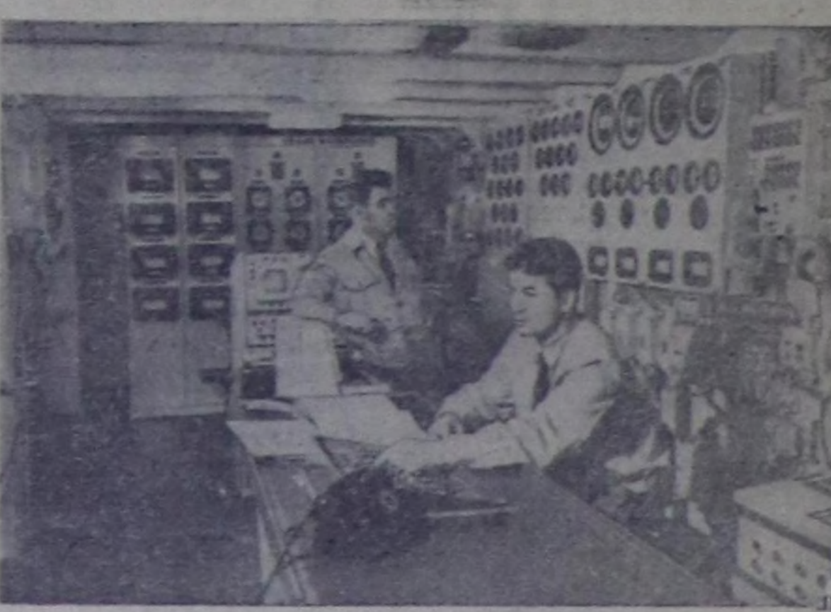
«Ленин» деп атомнуг ледокол Арктиканын суугарында баштайгы Ф байда дришкенинч сөөлүндө Мурманск деп далай өртөөлүндө чедип салчулга-Чөрби чоңуктуг дургузуна совет далайылар улвас болур Апаз олар-жичиринкиге кол чутула дош кырынкы шинчиле ажылды районук рунд талазы-биле белки шыгарыны көргүсө.

Съезд СЭКП Топ Комитетинге бөйрүлүгү чарыштын улуг көдүрүлүшүн-биле хүлээн алган.