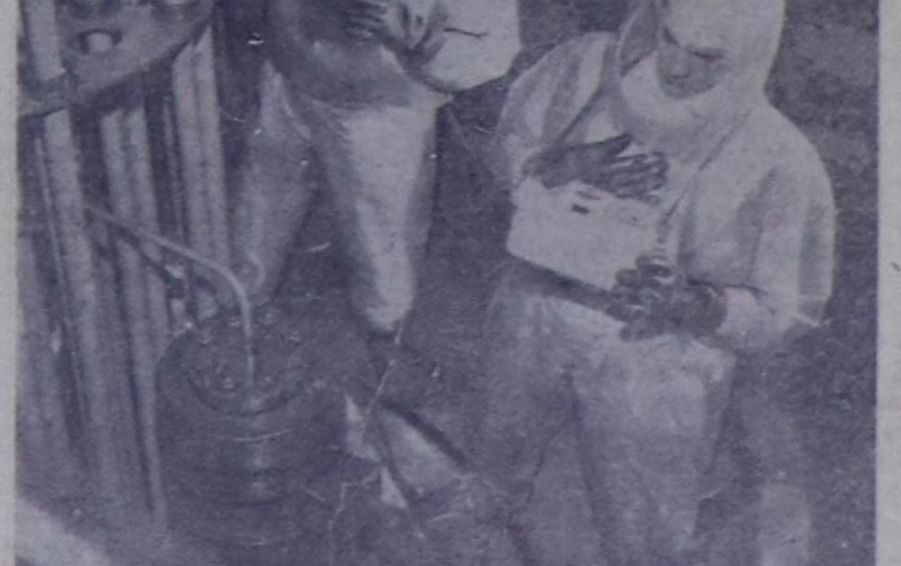
«Ленин» деп атомнуг ледокол Арктиканын суугарында баштайгы Ф байда дришкенинч сөөлүндө Мурманск деп далай өртөөлүндө чедип салчулга-Чөрби чоңуктуг дургузуна совет далайылар улвас болур Апаз олар-жичиринкиге кол чутула дош кырынкы шинчиле ажылды районук рунд талазы-биле белки шыгарыны көргүсө.

Л. И. Брежнев биле Раджендра Прасад олар чүве чугаалаан. (СЭТА).