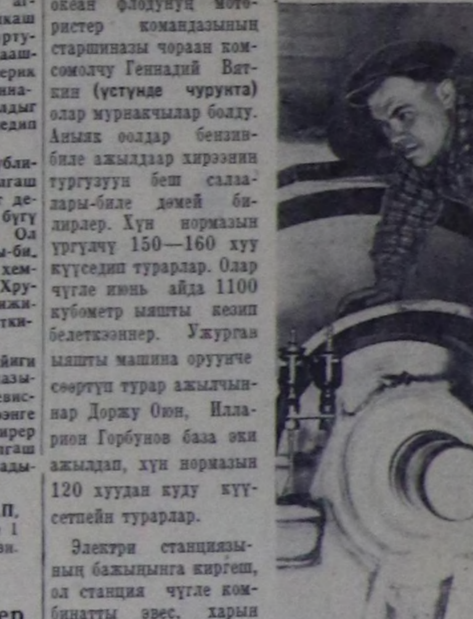
Болгаш өртемниң база техниканың аң чаа чедишкенин бодурулгеге нештередир доктаалды хүлөп алган. Шуурмактын улетпур комбинатын механикастаары келир үениң эвес, бөгүнүн сондааралды болбас со-рууламы болур.