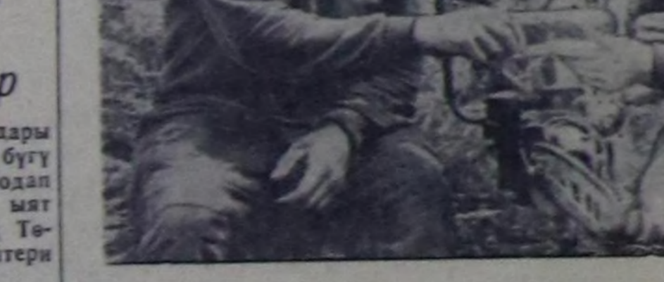
Сөзү болгаш фотолары А. Айрнини.

Сайлыг-Хемниң кат-чимистиг, чараш чурумдарың эринде чаа пионер лагери ачылганын. Мыда район школаларының эки өөрдүл-гели болгаш чурум-сагылымы 46 өөреникчилери дыштанп эгелен. Лагерь ажилдарының шүттү чыскалыга район организаци-ялары болгаш школаларының төлөөлекчилери байыр чедирип чүвө чуталгылаан сонда пионерки