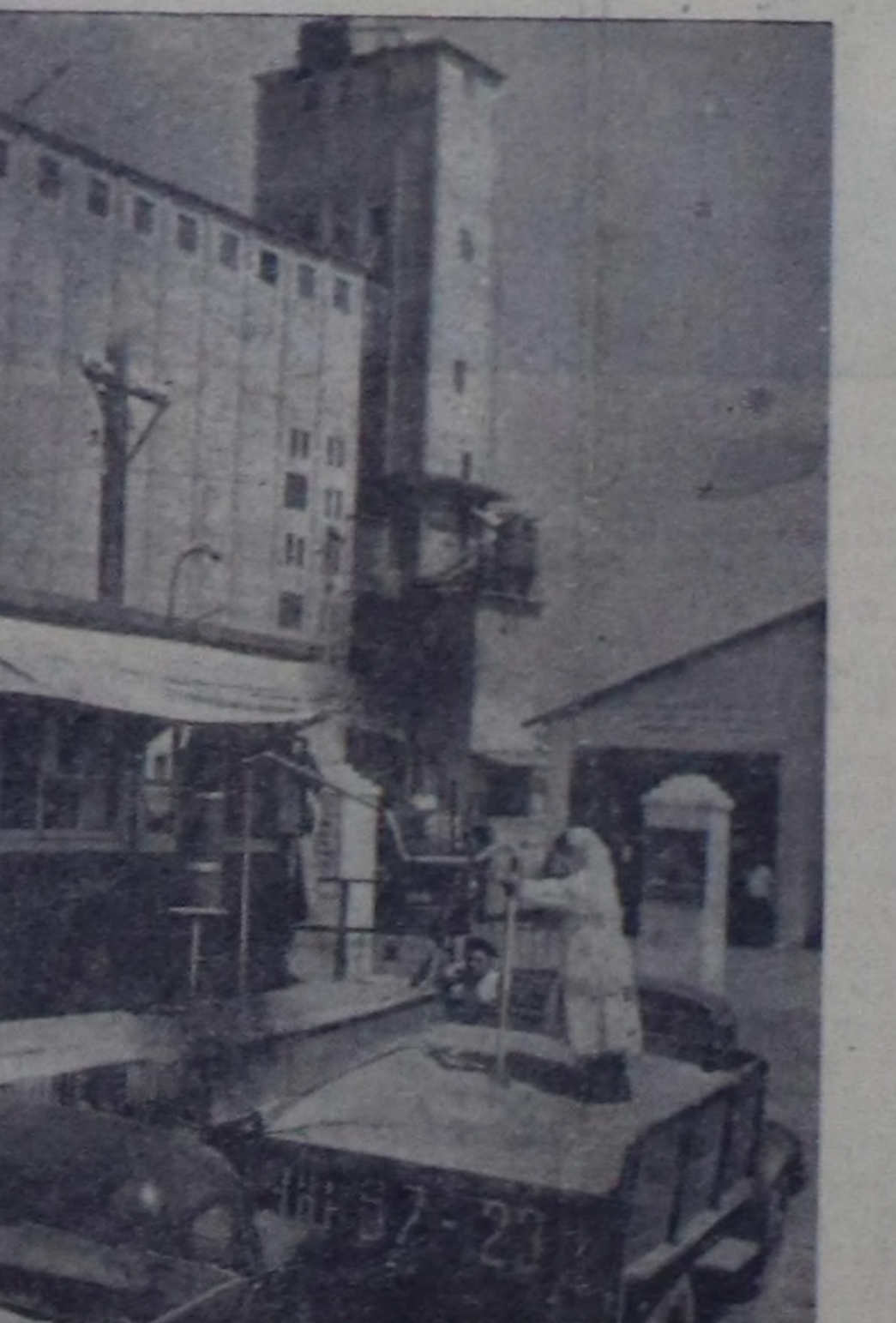
Краснодар край. Кубаның колхозтарында болгаш совхозтарында чеди чылдың ийги чылдың бедик дүжүдү дээш хайышканың демсел чоруп турар. Чаа дүжүттү таразы элеваторларга болгаш тараа хүлэи алыр черлерге соммал чокка кээп турар.

Көскү агитацияны калбартырынын талазы-биле бе чылдың өгөзүн-ден бөөр областың партия организациялары эвезон улуг амьдарыны кылдылар. СЭКП-нин Кызыл хооркому, Чөөн-Хөмчү райкому, Таңды районун «Межегей» совхозунда, «Совет Тыва» колхозта, мылангы «Тывакопаль» черинде партия организациялары болгаш еске-даа организациялар бе талазы-биле багай эвес ажылап, хөй санлыг плакаттары, диаграммаларын уткаын билдирер, хөжөм чараш кылдыр кылган клубтарга, үнөттүр бүдүрүлгө черлеринге, фермаларга, бригадаларга, куудучуларга база оруктарга даа акылдан. Үлөттүр бүдүрүлгө черлерде, колхозтар, совхозтар фермаларында чеди чылдың планының