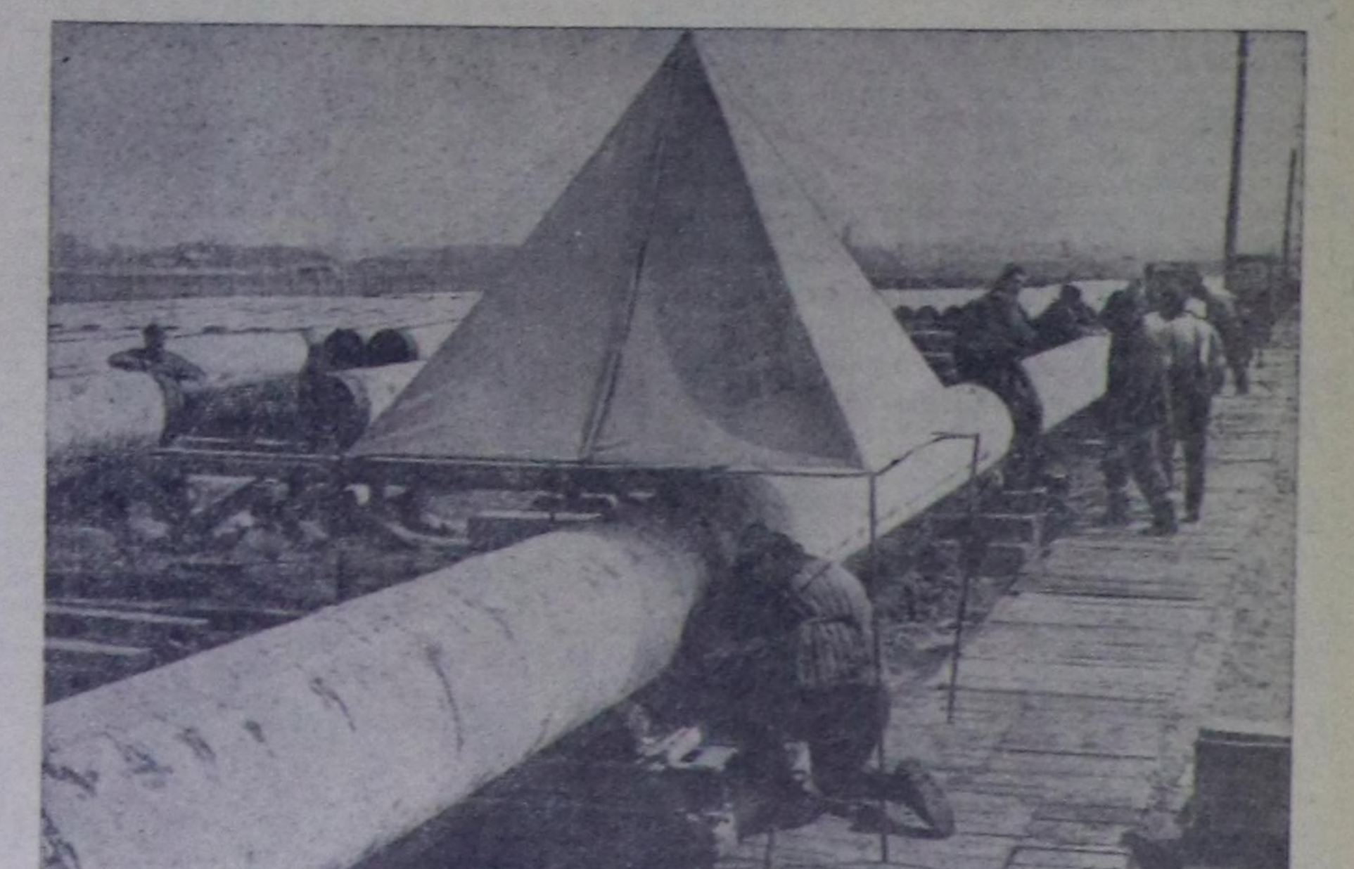
Совет Эвлюелин Польша, ГДР база ол ышкан Чехословакия болгаш Венгрия-биле тулуштурар тергенин улау нефть дачылыктарынды изил-тулук чорук турар. Мынды арга-биле нефтиниң дачылык чорук болза нефтин дачылыктарын харгалдык чүтүп ийлан хире катан чыгарар. Ук тулдугу ажилдары колхозунда шугуу механизацизаттыккан. Олар казар боду чорур экаваторларын, хоолайларын чер илчиге садыр механизмирин, аар чүк дажыр, сөөртүр болгаш хоолайлар ээр машиналарын дөш оон-даа өскө херекселерин мыда ажилдап турар. Ол-ла бугу техника барык шугуу Совет Эвлюелин болган. Польша тулдугуларга совет тускай өргөшчир дуузалан турар.

Чуруук: нефть дачылыктарын туудунда каанашкын ажилдары.