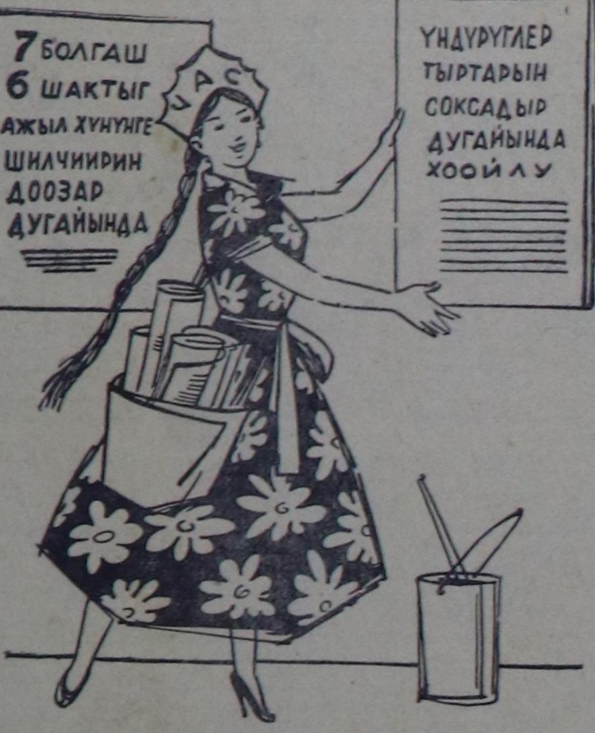
Чайнын хүнү узан тудум Чаңчыл эвес, элдеп болган: Ажыл хүнү кызырылган, Ада-чуртум белээ ол-дур!

Бажылашкын соода Кубаның төлөөлөгөш чүе чугаалап, Кубаның чазак бодунуң өргөлөрүн моң соңгаар-даа бажы-биле каагалар дөргөн ол онаалап меделгезин.