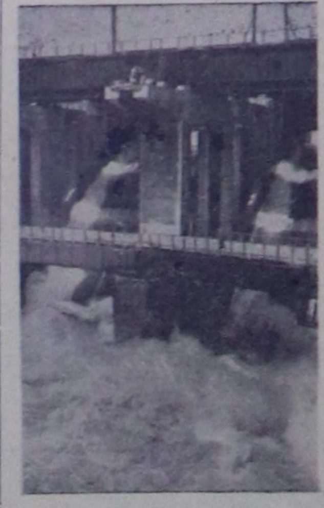
Сталинград. Волга-Ахтубинск онгарын Сталинград далайында суг- биле долдуруп турар, анза секунда- нын дүргүзүндө 25 муу кубометр хире сугну чаштырып турган. Оон түн- неленде, тодаргайларга ол ажалды чүгө ийи неделезинин дүргүзүндө суг шыгжамырынч үстүкү бөфинге сугнуу деңгези 25 метрден 23,5 метр чыгызын, а Сталинград чоо- гунга барык-ла 2 метр чедир бөдөөн. Чурукта: суг мөңкөзөр плотинанын кеңири.