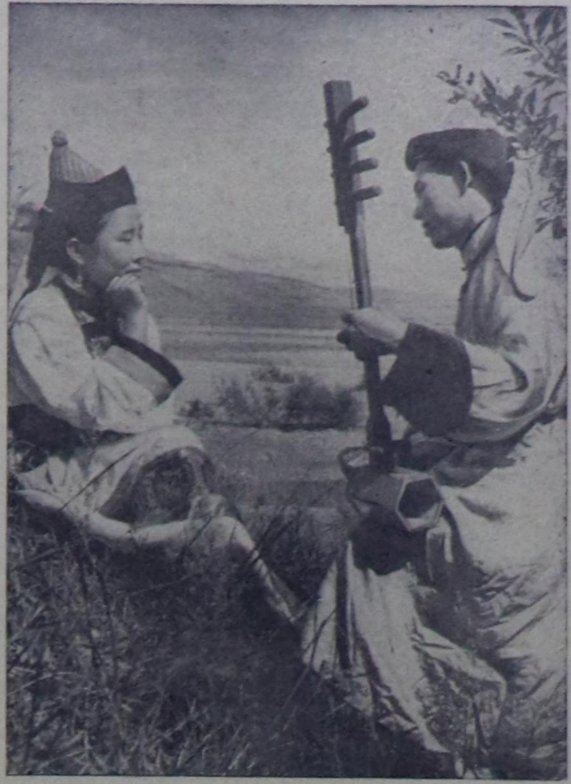
Төрөөн түрт дугайында.

Ажилчы чонун калбак массазының ортузунга лекция пропагандазын улам-на калбартып, оң белик деннедик, дээштик болуру дээш кол күчөткөйни салыр херек. О. МАНДАРЫЙ, «Шының» корреспонденти.