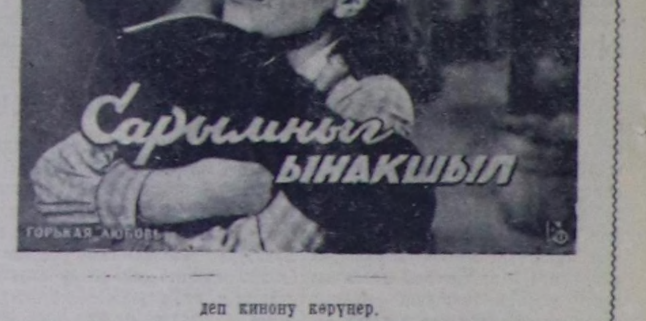
деп кинону көрүнөр.