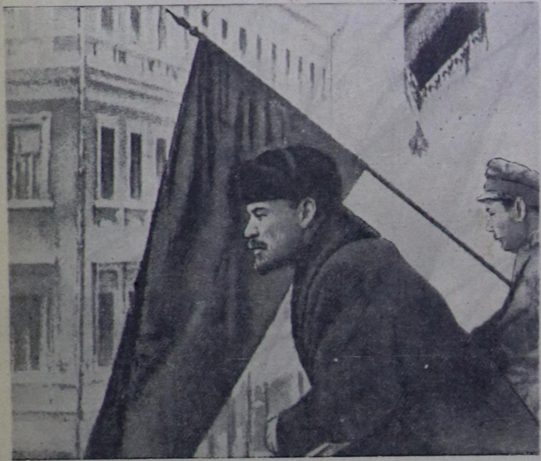
В. И. Ленин Москвадәги Балкондан Деникниге уду демиселче айтган тур дайычы коммунистерге Сайы чедирип тур. Москва, 1919 чылда октябрь 16-да (кинолан алган чурук). (СЭКП ТК-ның чанында Марксизм-ленинизм институтунун парлп үндүрер деп турары альбомдан алган).