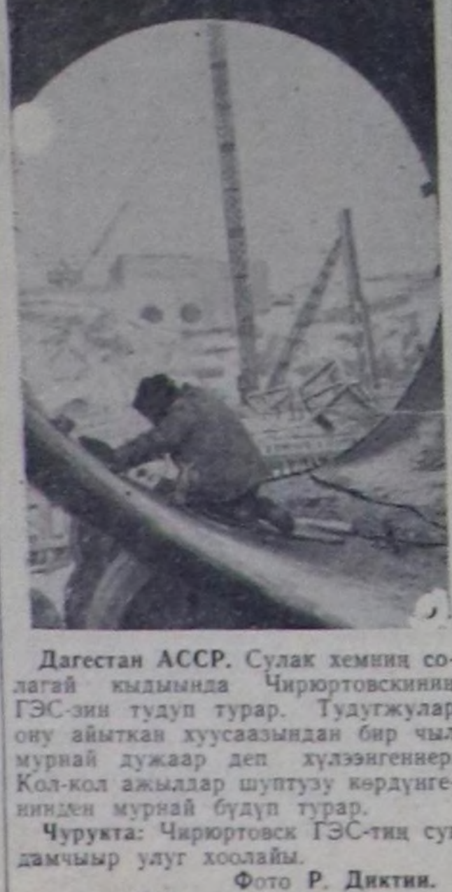
Дажестан АССР. Сулак хемия солагай кылдыла Чирюртовскиниң ГЭС-ни тудуп турар. Тудуужулар ону айыткап хуусаазында бир чыл мурал дужаар деп хүлээгенер. Кол-кол ачылдыр шүттү көрдүнгөндө мурал булуп турар. Чуртука: Чирюртовск ГЭС-тин сүт дамчыр улут хооланы.