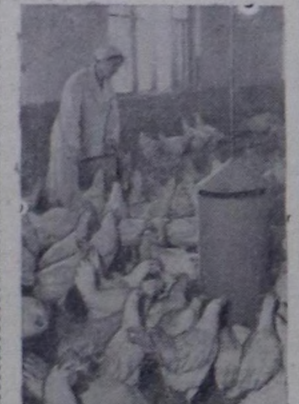
Москва область Люберецк районда Дзержинский аттыг колхозта 5 муң дагаалар кирер чаа, механикаизаттынган кажанын туткан.

Оюл мурунда норма эсуугар бир дөрбөчкүн метрге 6 дагаа онаажыр ажурлуг турган, а бо чаа, механикаизаттынган кажыда 10 кыс дагаалар турар апарган. 5 муң кыс дагааларнын кажыда-а ам агар таарымшыркымы, бүс-биле одалга, асест-ментиден кылган хоалайгыштарым сугарыкчылар, кыштын кыска хүнүн уздыр тускай херелдер үндүрер лампалар бар. Ол ышкаа дагаалар боттары чөмөн-нор саваларын кылган. Ону неде-ляда бир удаа дагаа чөми-биле додулар.