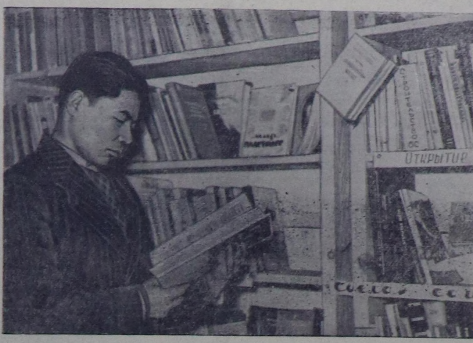
Кызылдың Н. К. Крупная аттыг библиотеказы номчуучулар номну ном фондундан барып боттары шилип алырының чаа аргазыч кирген. Мындыг арга номчуучуларның номну шилип алырынга дыка таарымчалыг болуп турар. Делгем чырың залдың ном делгези полналарында номнары тус-тус адырлар азый-

Бистир областа аш-чөмнүң болгаш үлетпүрүнүң барааннары албек, садыг четкини улам-на калбарып турар. Моон-биле калы салдыг организацияларының ажилында улуг четпестер барын база айтыр херек.