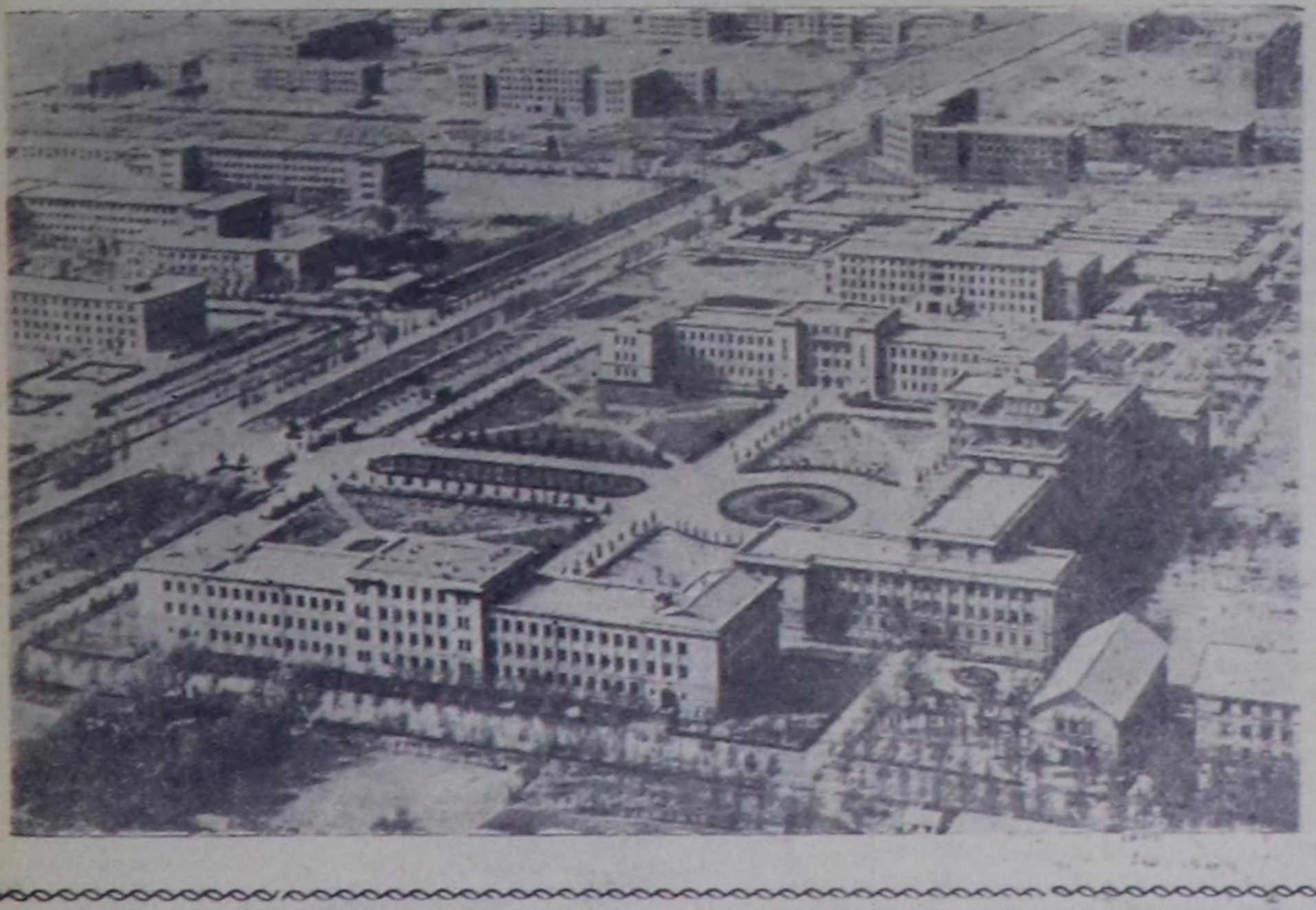
Кыдат Улус Республика. Чурт- туң майымыламы — Пекин хоо- райнын сонгу-барынын кыдыг чер- леринде аарыг-шиччелде иштиг- туттарынын болгаш он ажил дээш өөредилге черлеринин тур- гар чаа улуг-улуг бажынарын туткулаан.

РЕДАКЦИЯНЫҢ АДРЕСИ: Кызыл, Шетинкин кудумчузу, бажын № 3. ТЕЛЕФОННАРЫ: редакторун 24-63, редакторун оралкычынын 35-24, партийки амыдырал кидизинин 23-54, харысалгалыг секретарынын 37-13, көдө ажил-агыи кидизинин 22-64, иштиги информация кидизинин 21-47, пропаганда, үлетпур болгаш транспорт кидизинин 23-35, чагаа кидизинин 21-27, культура болгаш амыдырал кидизинин 25-38, корректорларын 20-60.