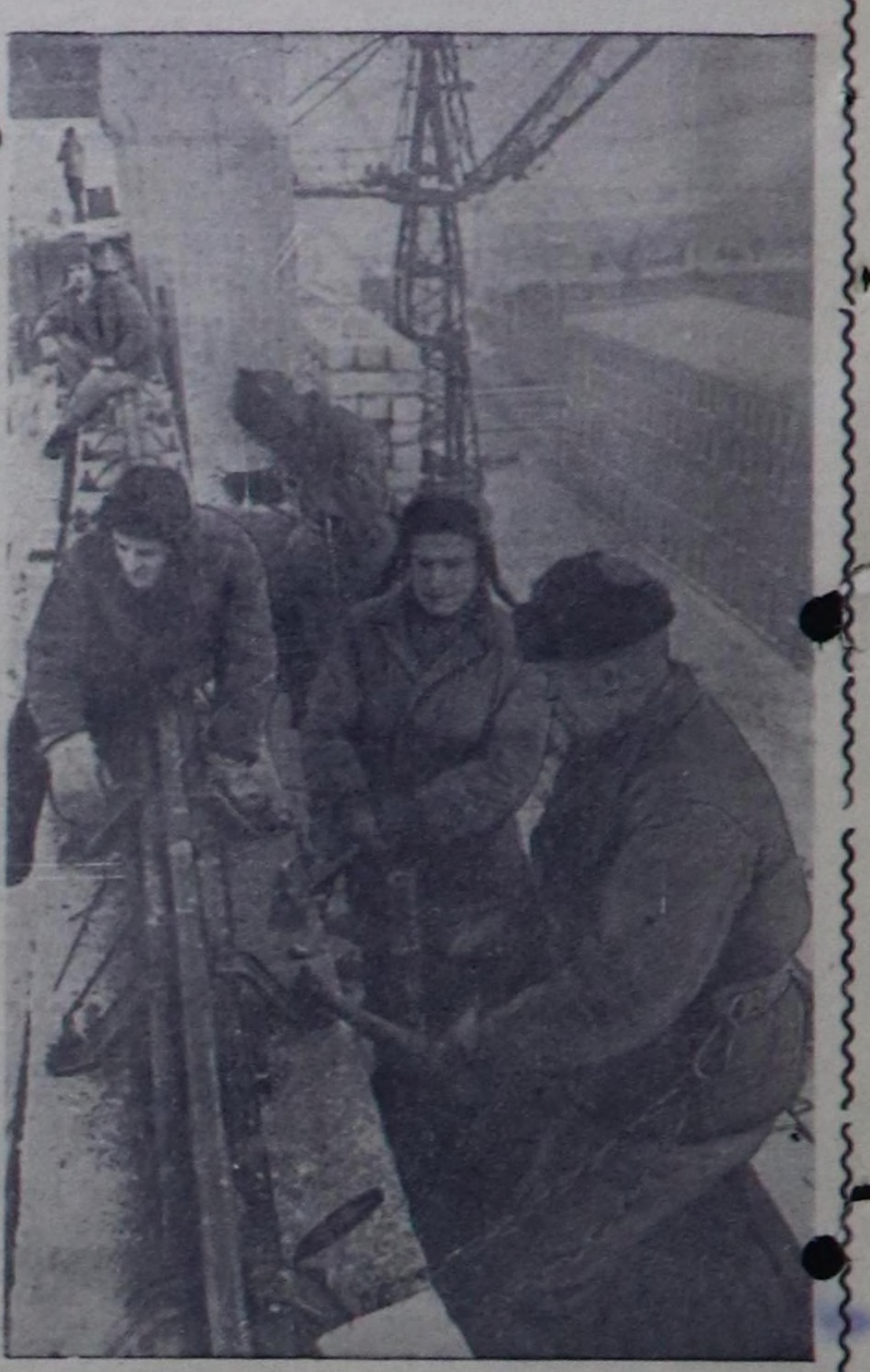
КУЙБЫШЕВ ОБЛАСТЬ. Куйбышевгиротунтуң №1 эргеле...