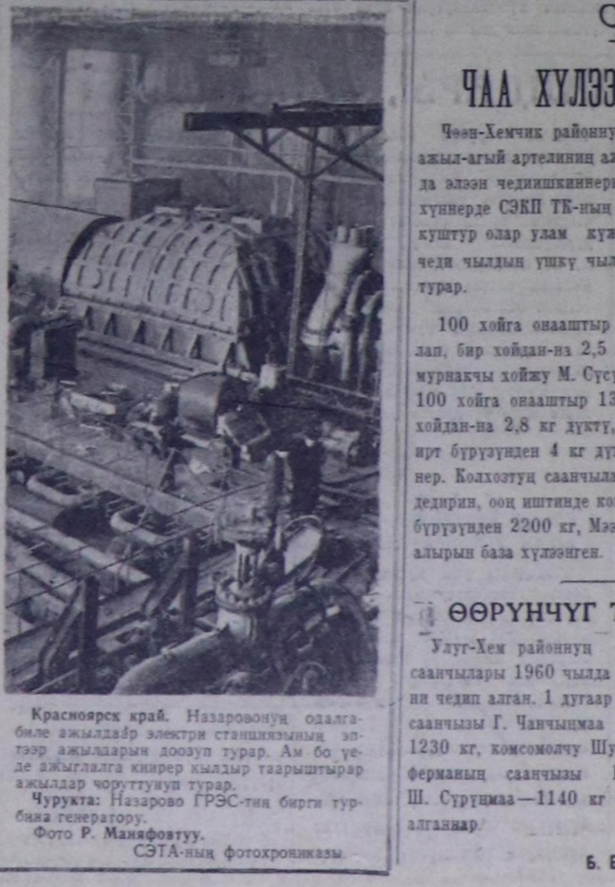
Красноярск край. Назаровонун оналга-биле ажалдар электри станциязынын эл-төөр ажалдарын доошп турар. Ам бо үе-де ажаллагга кириер кылдыр таарыштырар ажалдар чорутууну турар. Чурукта: Назарово ГРЭС-тин бирги тур-бина генератору.

Улусуң херектел бараанынын дыка хөй хевирлерин бугу-ништи үн-дүренин талазы-биле оналгалар баа-ла ажыр күөсеттинип турар. 1 миллиард метрден хай хөвөң-саалын пестерин, барык 110 миллион көкөс санын трикотаж—арыгалык кылы-дарын, 65 миллион эштен хөй хөм идиктерин, 14 миллиард ажыр рубль-дин култура-амырал херекселде-рин болгаш ажал-агый херекселде-рин контроль чургайлардан артыр үш чылдарын дургузунда бугу-ниш үндүрер.