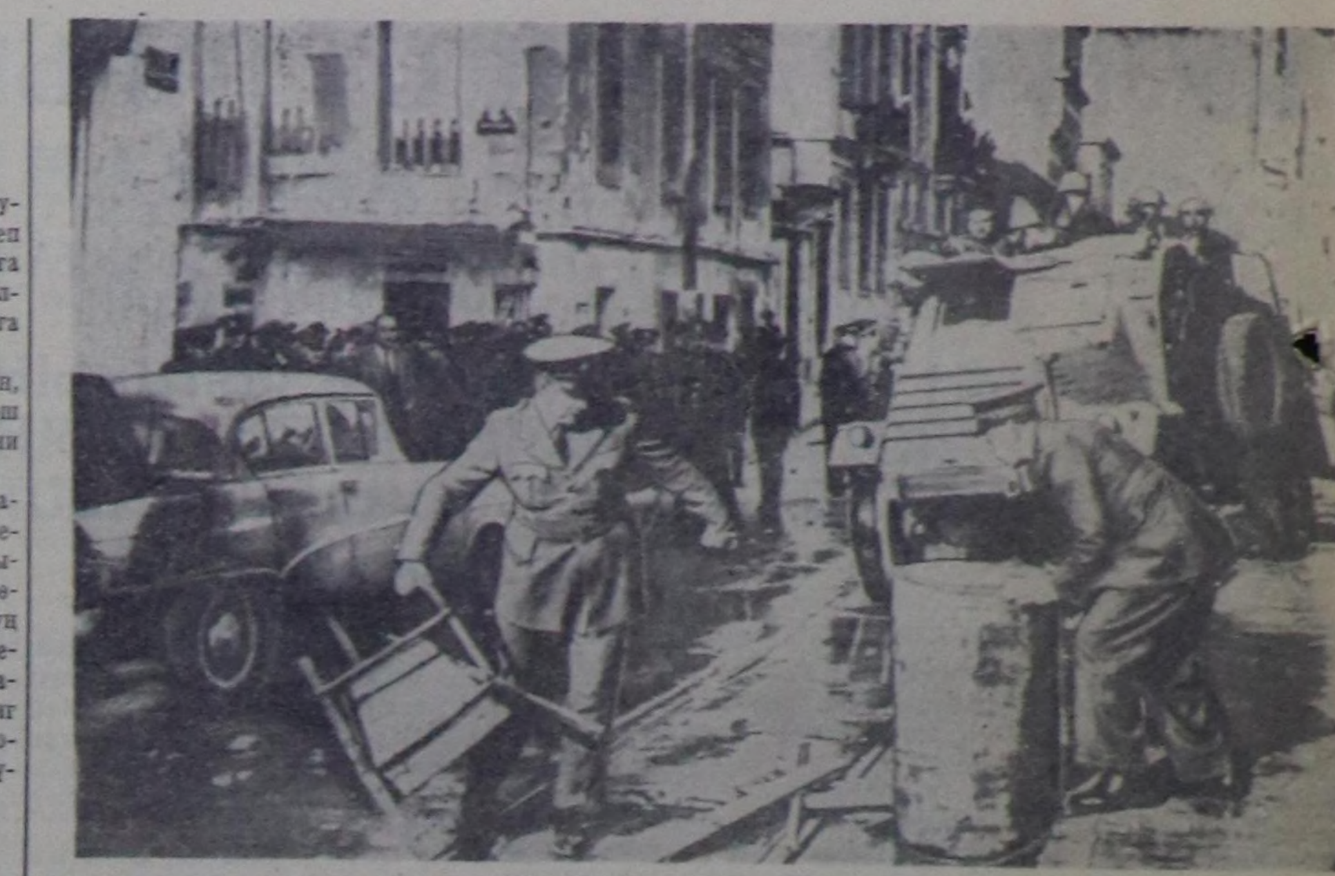
ГРЕЦИЯ. Декабрың эгезинде афиниң тудугуларың бүгү-үнүти ажал соодалышымың болган. Политиканың болган жаалдарыңың от-рияттары оларже халаашкыны кылдып, караа чакы төгүдүлөр газыг бомбаларың ажаллашкан. Оманьяның төп шөлүңиң районунага ёзулуг тудуучушкун болуп турган. Чүс аажы кижилер ботандырыңа.

БУДАПЕШТ. (СЭТА). «Эшти хир-лаш» деп венгр солун ССРЭ-нің Дээди Сөвединиң сессиясына ССРЭ-нің Даштыкы херектер министри А. А. Громыкоң илеткелиниң допчулаалың даразында эге-биле парлаан: «Дайың кижилер төрөгетениң амдыралыңың мөңгөш-биле болуруйң барып болуруңуң үеңиз келген—Совет Эвилелиниң тайбың политиканың ол соорулага беран болуп турар». Илеткелиң кол-кол черлерин шүгүдүң ол солун кара уагктер-биле ийикке азы күрөш-биле өнө-лаш парлаан.