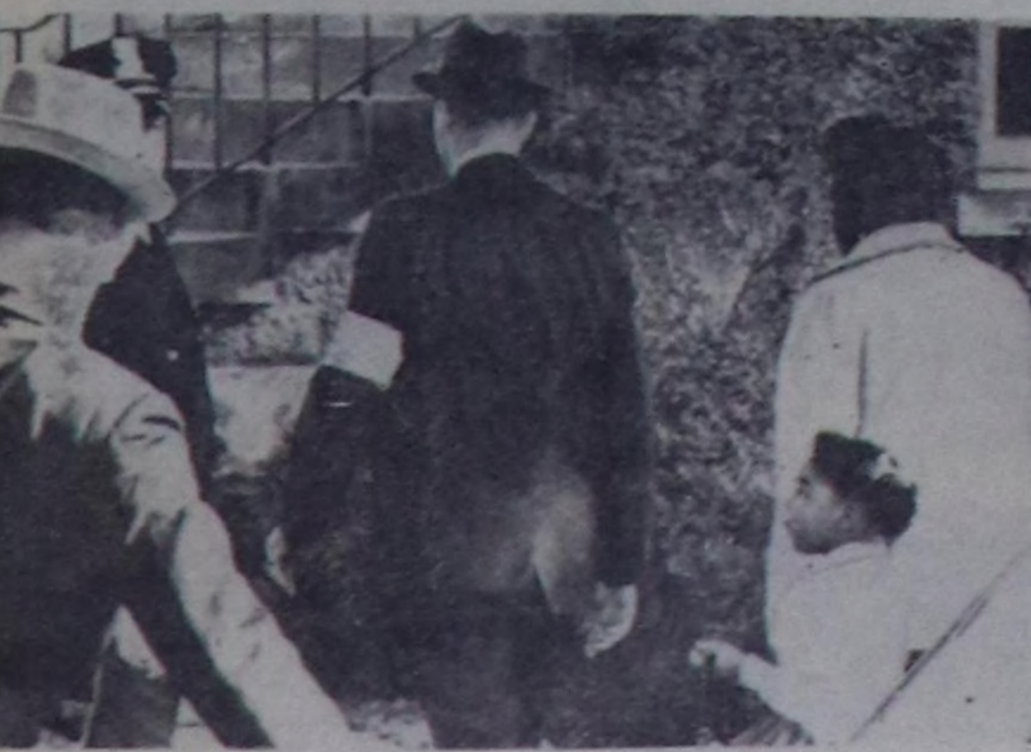
Америкалык Каттышкан Штаттар. Чаз Оран коорайнын шко- ладына хоодуу өзүгө негрлерин болгон ак кештиг кижилерин аңгы-аңгы өрөнчү чорун удуулаштырган учурагү. Сентябрь- нын ортан үзгөлдө ада-нелер дөрт негр кыстарын школага чедирип-кел- генер. Мынчаар орта расистер келер турганаар. Олар негрлерге хал- дап, школанын илер эркинин чыныга чедик үгөлдөгүн кылган.

Ук черде политикагү хайгаарачкылар үзгөлдө мусылман чурттакчы-