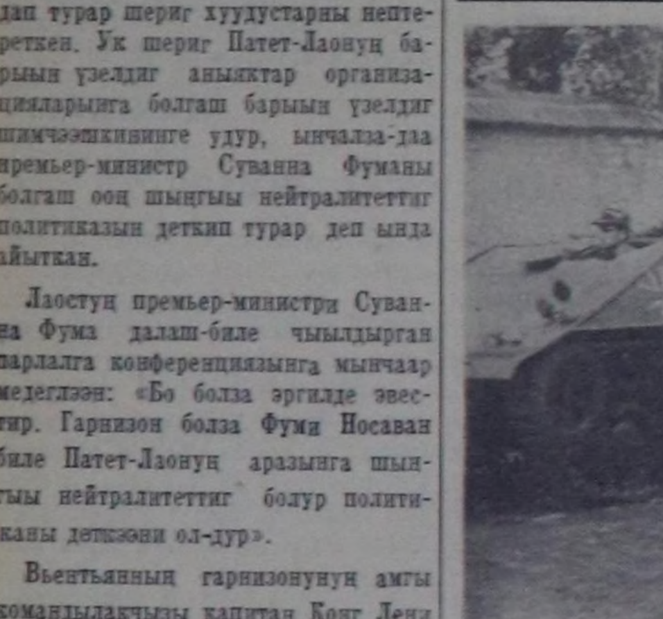
Францияны оруктарында барылы-герман солдаттарын сөөрткөн бонн танкылар чоруп турар. Булдесериниң 35 муң солдаттары Францияда кел-генер. Француз хоорайлар Мурме-лонку, Сиссонун худучуларында булдесерини офицерлери шөзөн ба-зып турарлар. Олар француз казак-тын чөшпөөрели-биле шериг өөрдил-генин кылдыр дөш келгенер. Фран-цуз улус оларга удурланып, киле-нен турар.

Херэжеп шыдыраачыларын мар-гылдазын чоруп турар өрээлге кире дүжүлөп, Кызылдың көдө ажыл-агый техникумуңуң үшкү курузунуң өстөрүнар салбырын студентини Зинада Ооржак Каа-Хем шыдыра-чызы А. Прасолованы каш-ла кош-кеш, уда шаап каан. Ычангаан 3. Ооржак маргылдазын төнчүзү-гө чедир бир салыг артка-даа, оон түнелди анаа кандыг-даа болза, оон хамаарыга чокка 1960 чылда херэ-жени шыдыраачыларын аразында область чемпиону атты чаалап ал-ган. Анык шыдыраачы 9 салгылар-дан 8,5 салыг алган. Т. Чат—7, Е. Байлар—6,5 салгылар, оларын аразыга ийги чер дээш демисел болду. Тоску салгы эр шыдыраачыларын аразында болган. Ийги чери ху-нажык турарларын бирези Ю. Сундуй Ламаш-оолга удур мерзе гамбинди эгелеп көшкөш, туружун дыка экижиткен Ламаш-оол кара-чаныг шын көшөр-биле камгала-нып турган, хенертен удур согуш-куну кылган. Оон ах тала атаказын оскунган, чоорту байламы баксы-рааш, уттуруп каан. Чодок база Чамзырай-биле мерзе гамбинд ой-нааш, элекке хүлүн эртер бурун-гаарлар 2-ги шугуну кошкаткаш, олче уаурланкычыны күштүг бо-даларын кирипкеш, камгалаа тып-