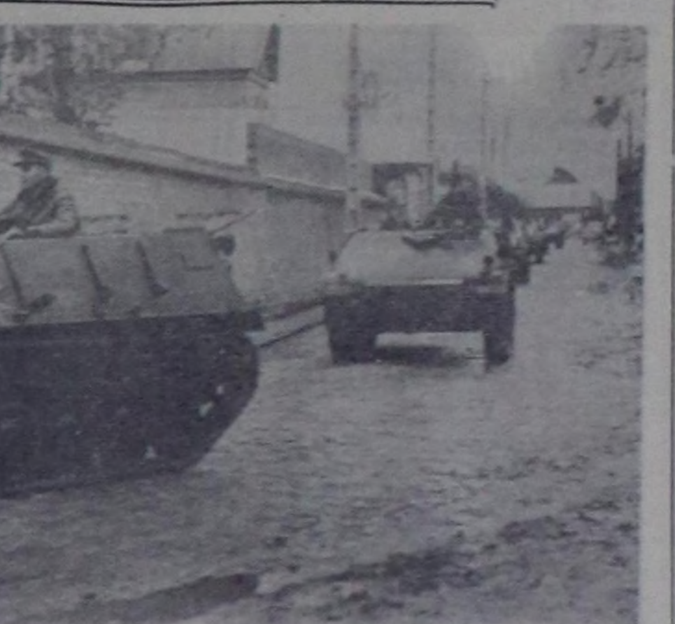
Чурукта: Сиссонун худучуларында боннун танкылары.