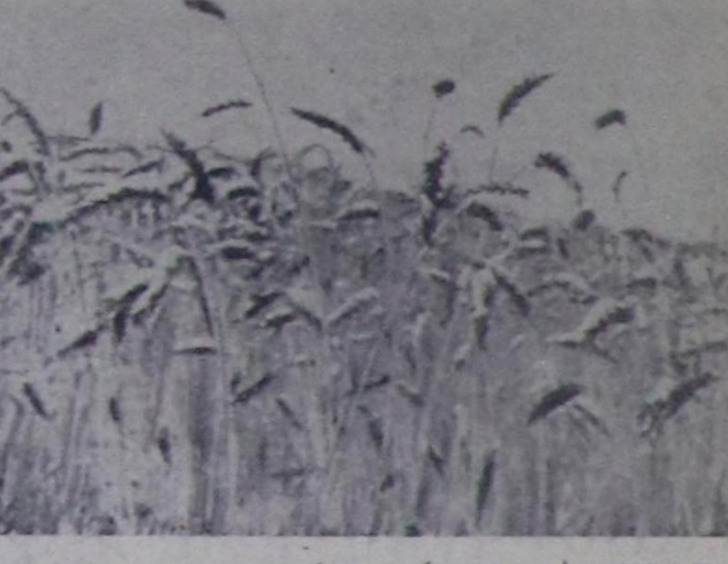
Кызын тараа үнмөс дээрин бугуруге билдингир. А мыңа-ла-да харга бастара берген чагаай кызыл-чамдык фото-чүрүткөн номчукчу өскөрүн каар. Бо дөргө Каз-Хем районда «Совет Тыва» колхозтун Чинге-Даг деп чөпкөр чорукту-дур. Сыпта тараа болза чагаар үнгөн чөпкөр-биле-тир. Колхозтун удурткучулары ону үдө ажаап албайн барганы алынгат.