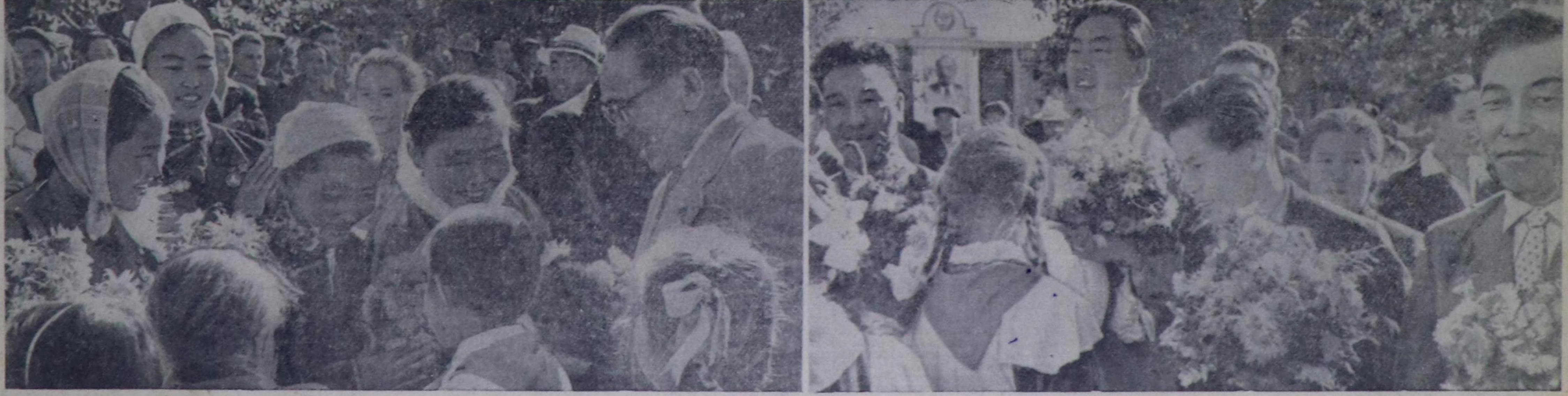
Чурунта: Моол Арат Республиканың Хубсугул аймааның концерт бригадаларынын кижикчилерин уткуу ап турары.