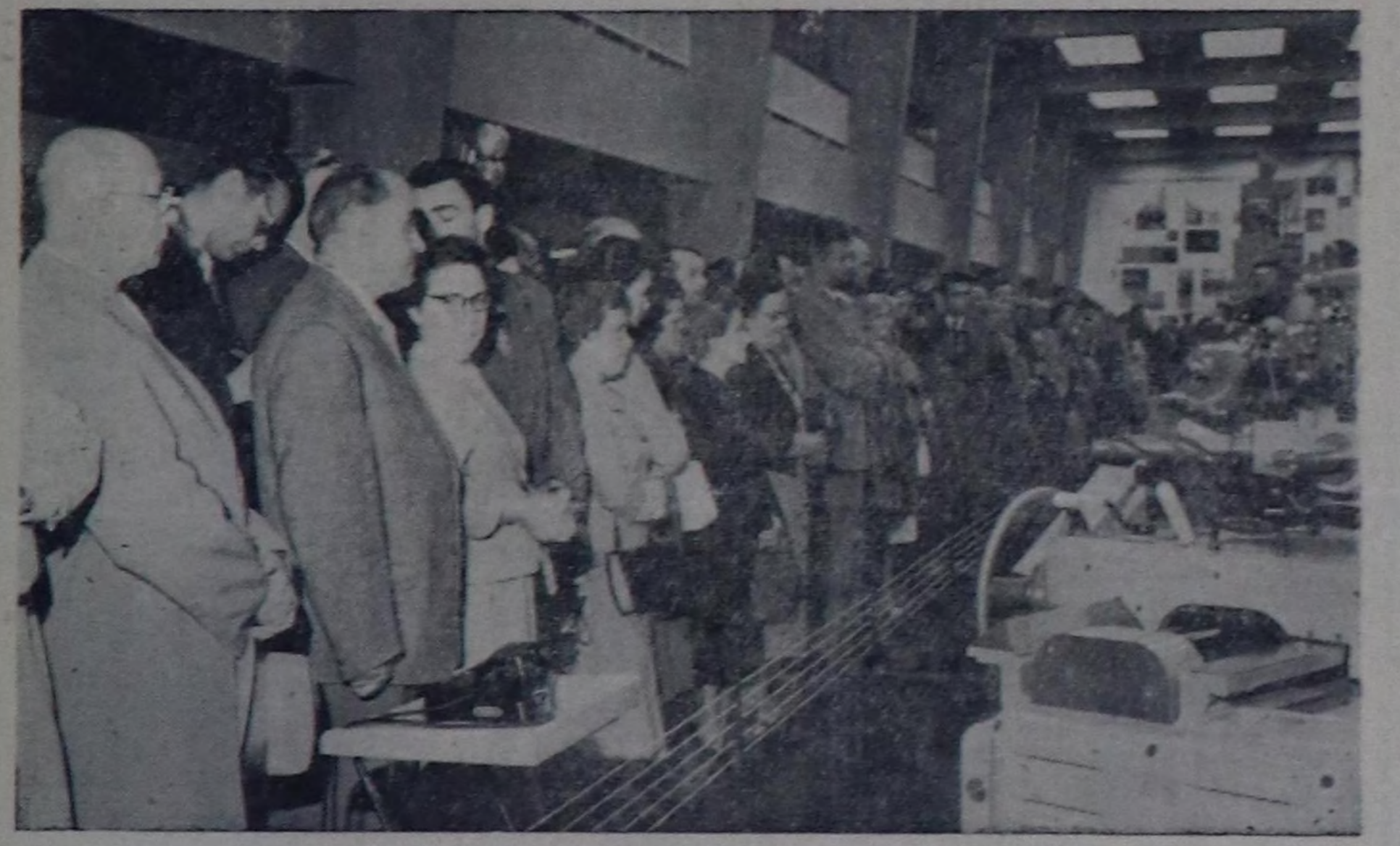
Москва. Культураның болгаш дыштанылганы Горький атты төп паркында Венгрияның үлетпүр делгелгези ажиттынган. Чурукта: делгелгени көрүктүлөрүн көрүп турары.

Августун 28-те МОЛ АРАТ РЕСПУБЛИКАНЫҢ ХУБСУГУЛ АЙМААНЫҢ АРТИСТЕРИНИҢ КОНЦЕРТИ БОЛУР Концерттиң эгелээри—хүндүскүнүң 4 шакта болгаш кежээкиниң 7 шакта. Билетти хүн бүрү театрның кассазыңга хүндүскүнүң 12 шактан, улуг универмакка 11 шактан эгелээш садар.