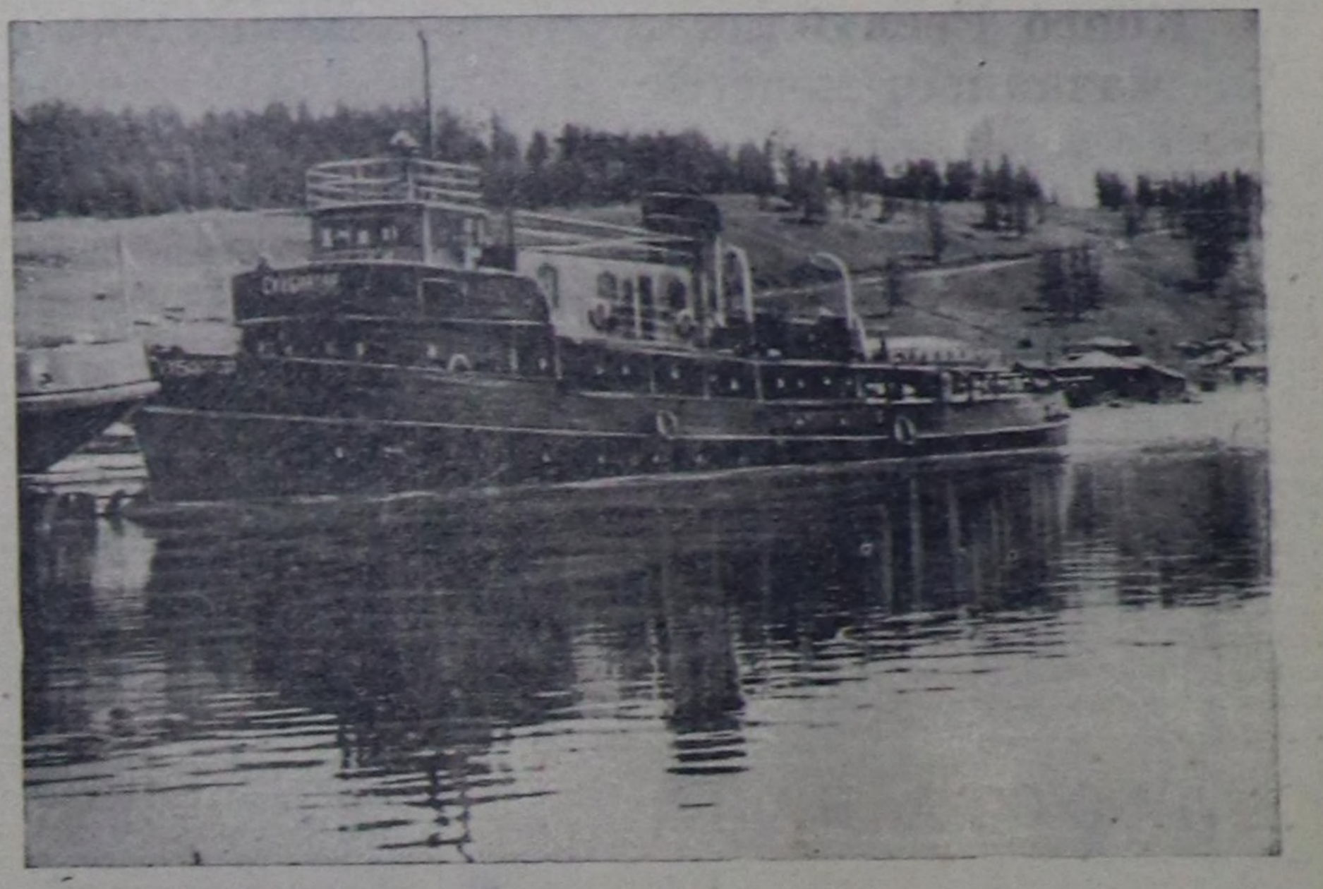
Чурукта: Хубсугул халде «Сух-Батор» пароход.