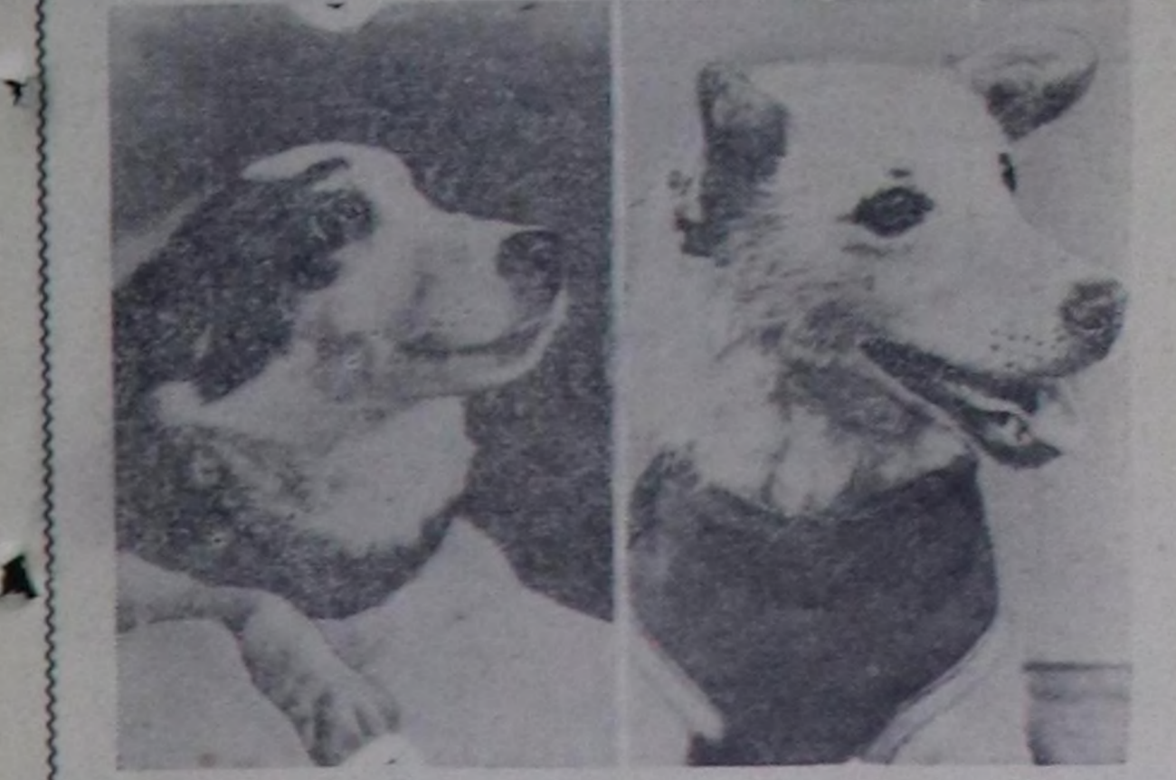
Октаргайже жудушкуннар үезинде кижиниң амырар-чорудуламы, а ол мыткан оң оозалдыкка таарышпазын болгаш Черже эеп келирин хандырып турар системаларын улам ыңай ажылдап кылдыр сорулга-биле 1960 чылдың август 19-та Совет Эвилели Черниң аэриачынының орбиталыч космиктиг ийги кораблыды салып үндүргөн. Кижиниң келир үеде уждарына эргежок чугула бүтү-ле чүү-дөр-биле дериттинген хайнага дуржулгага херегерэз амытанар, оларнын аразынга «Стрелка» болгаш «Белка» деп шоолалык мтар чорзат. Чурукта: Октаргайга чорган «Стрелка» болгаш «Белка» деп мтар.

Школячыны мага-бо-дуну доктаганынын азы, оозалды каап турарынын чыдаганын тодаргай-чыды-биле эмчиге көр-гөзүр эргежок чугула. Чүп, делзининч нежээр кузун чаксымыдан ул капап улуг болур. Дург-сымынын бедип өзүленинч моонхакта-эзери чазын күскүзү-