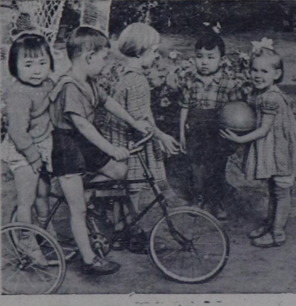
Кызылмын уруглар садмын бирөөлөсө.

Чырык хая соруланган Смынын кырын эртий көрдүм: Чыраа атыгыт, кымыл тоңууг Чылгычы кыс кымыл бөлгөш, Менче шиглей куштадымты, Менчөөн мыткан сырбаш кындым. Чоогаже чиле дүштү, Сохкан чүрөө дүргөдөп тур. (Сында турган малды көргөш, Чылгызынчап чорткан-дыр дээш Эндэ тааны менде келди. Эжен суде чүвү сөглөйиң). Хереп келген хүнге чайып Хебертен бо көстүп келди. Аймап турган чүрөөм ик дээш, Арнам дораан ишм-ле дээш, Эзерлиг айт көрүп каапкан, Элдесенип эй тыртты. — Адыр дуным диктаанар—деп, Алгырыпкан, утуй бардым. — Бурулууг-ла бодум, ажым. Мууну чораз малзынарым Мээң чылгам өөрү-дүр дээш Бесин далаш далайп келдим. — Чок, чок ынар ажырбас оң, Чолдуг, тайбың болур салыр, Оор-суук эвес, дегелер-дүр мен. Ойлап десе, доним—дидим. — Карамайай тур мен ажый, Караанарда шымын бар-дыр Чылгыч арай тарап чор—дээш, Чырааладым ыңай болду. С. БЮРБЕ.