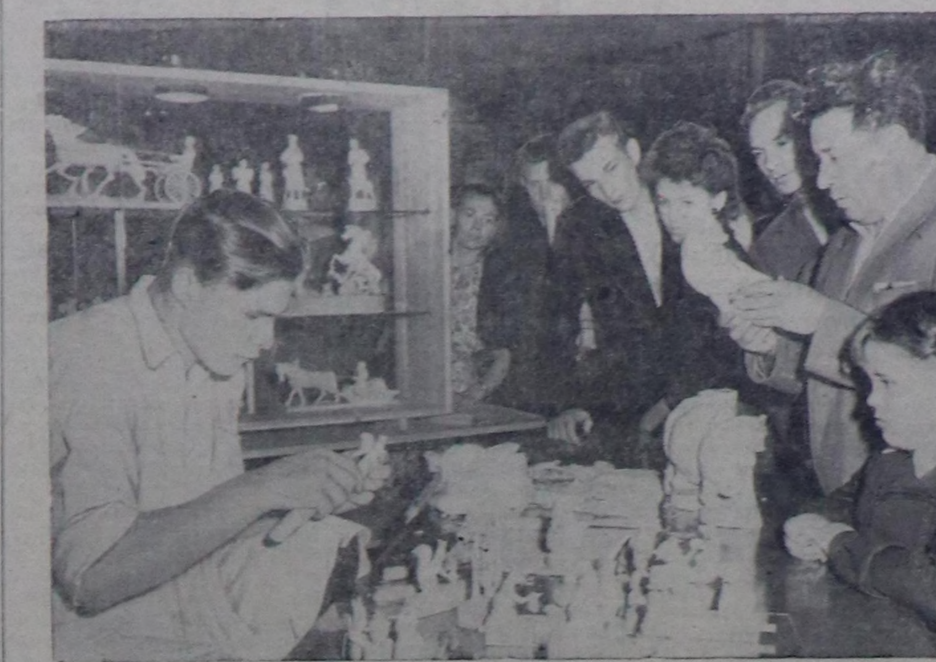
Москва. Улустун уран-шевер мергежилдиглеринин кылыгыларын Бугу-Россия делегация Төп делегеле залында ажиттыган. Чуртунта: «Богородскийн шевер чазыкчылы» деп артедьин мастера Н. Бадлевтин иштан азын чүгө чазап олурарын делегелеге келгенеринин сонугурап турары.