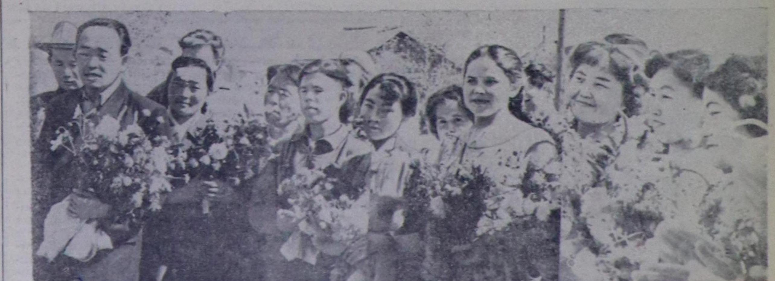
Чурукта: Хубсугул аймаанга чоран бригаданың бедик киржикчилери.