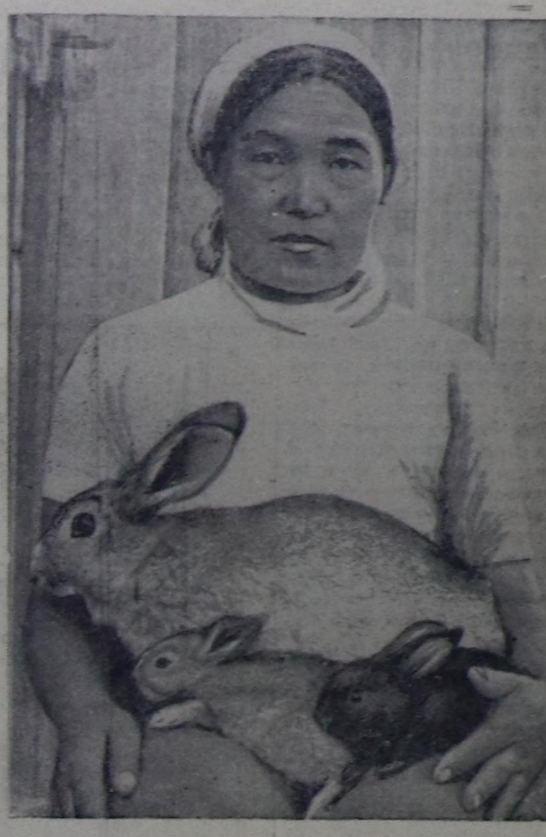
Нияттиң амжыл-агыйныг база бир орулгалыг адыры — тоолай амжылды көгүдөр дөң бистиң колхоз эртен чылдыг августтан бээр тоолайлары өстүрүп эгелээш. Оларны ажаап өстүрери мен хүлээнип алган мен. Ганым эвес амштанары амжар, оларны эдержиңгези организастаң, чаш тоолайжыгыштары до-руктурары белең эвес амжыл болур. Колхозтун дилги, тоолай фермазыныг эргелекчиси эш Бочка-рың тоолайлары канчаар ажаарың зоотехниктиң чурумарында мени өөрдөп, улуг дуузың чедирип келген. Ынчангаш тоолай ажаарыныг аргазынга өөрен берген мен.

Тоолай фермазы догандыр чыраа, терек-биле бүртөгөткен Ийи-Дыт деп черде турар. Тоолайлар турар чери догандыр херимнээш. Оларны көк сүлүмүс-биле баа тал, терек буузу, сула-биле болгаш өскө-даа кемнер-биле чегерип, доктаамал суггарып турдум. Төртөө тоолайлары чаш ооллары биле кады амшталарга, элөөн улгаттар доруккан тоолайжыгыштары ажаап центипен шалаан кажаажыгыштарда ажаап турар мен.