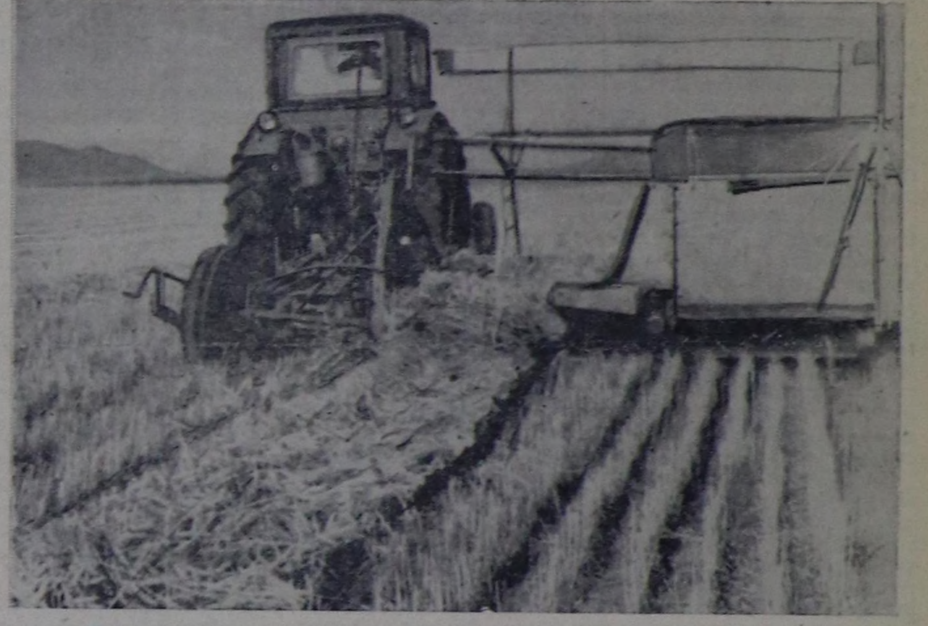
Танды районда «Тиллелге» совхозтуң бешки бригада-зы тараа ажаап алышыкыны киди-не тулуктеп чору-дуп турар. Ховунуң ажил-ишчилери шаг-үени анаа эр-тирбейн, хууну-не эртеңгины эртенгелден эгелээр, кезжэ орайга чедир чаа дүжүттү ажаап ал турар.

Дагестанга Совет эрге-чачыгының дөртен чылдың байырлаалының хүниеринде республиканың ажилы чоннары чедип алган чедиишкени-ри база бөдүнү культуразының чедетелишиниң дөш Коммунист партияга болгаш Совет чаахаа чү-ректин ханызын өөрүп четти-ришкенин илереп, олар-биле ка-ды найырдалдыг чаңгыс ай өг-бүлөгө коммунист тургузуп турар орус болгаш өске-даа улустарга ышкы байыры чедирп турарлар.