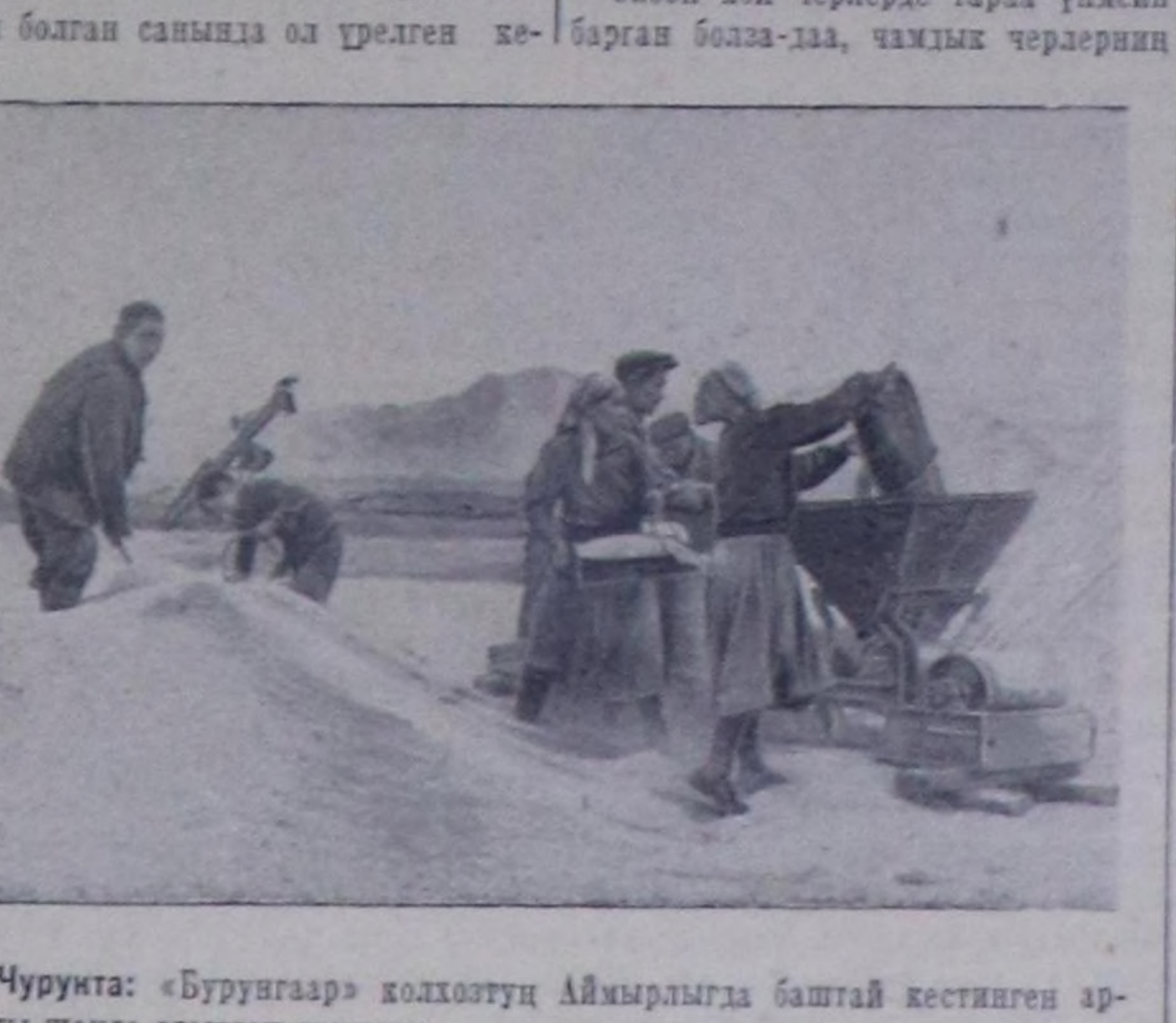
Чурукта: «Бурунгар» колхозтуң Аймырлыг баштайг кестирген арбайны шаңда арыгап эгелзени.