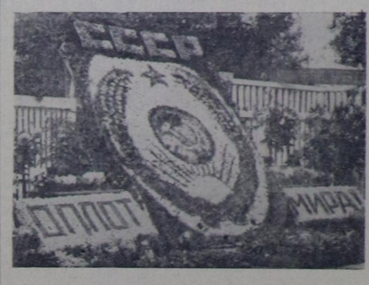
Чурукта: облукукомунун ишти-ки хедертер эргелениң коллек-тивинин делгелгезге килген че-чектери.