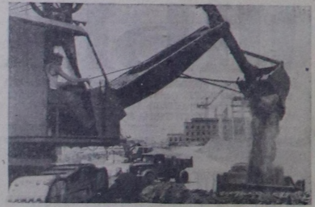
Астрахань область. Волганьң солагай өршинде саазым-картон кылдыр улуг комбинатты түдүп турар. Ол бұдуруге сава кылдыр картонну, саазымны, волонистиг плиталарын, картон хааржактарын кылдыр. Ол продукцияны кылдырып кымыршыты амырлар. Областа кымыршыты кураары чыл бүрүдө ийи миллион тонна болуп турар. Комбинаттың бирги өөлүзөн 1961 чылда ажылгага киялер. Чуртунда: комбинат түдүүнүң шөлдү.

СЭКП обкомунуң бирги секретары эш С. К. Токанын илеткелинден