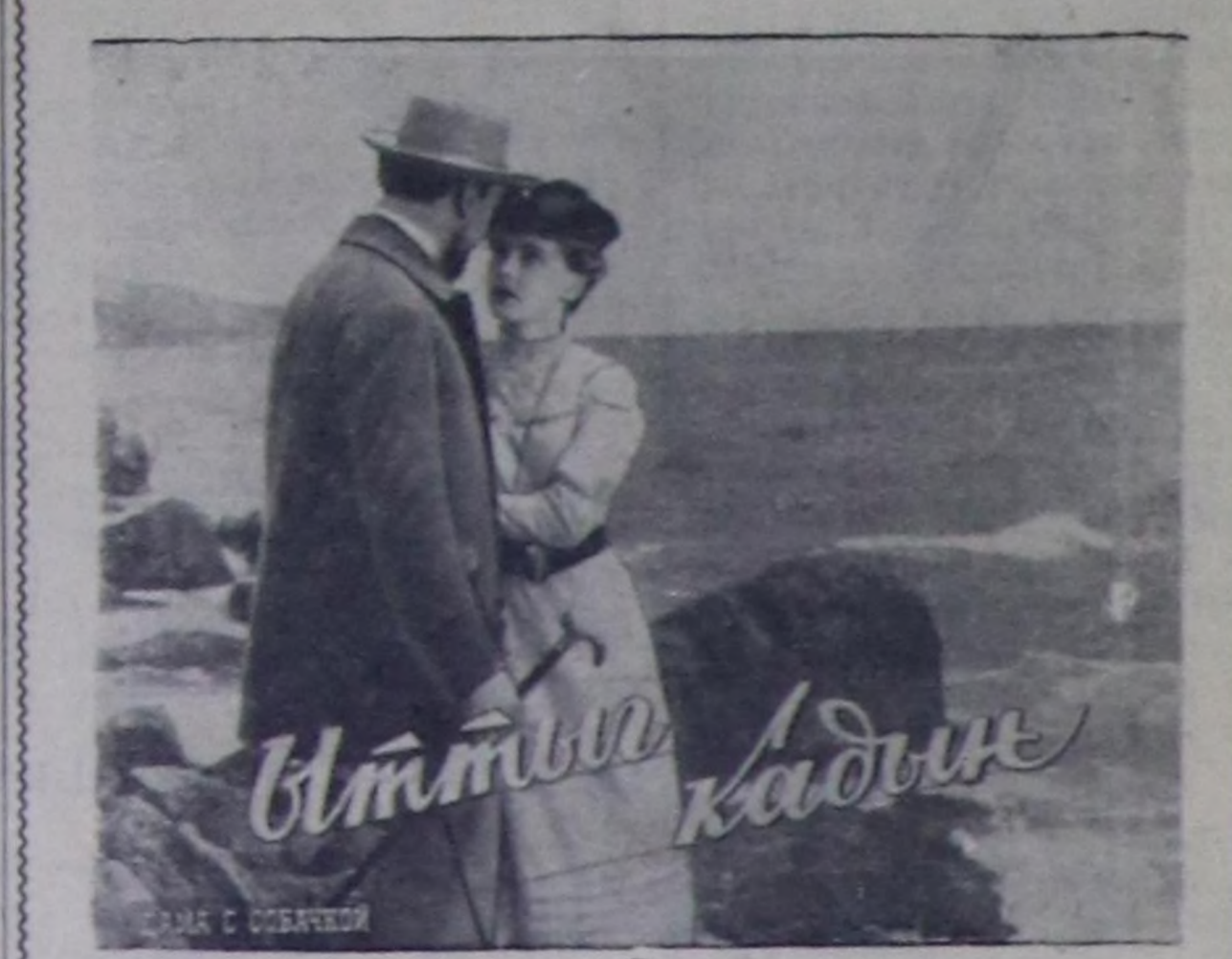
«Витый кадый» деп кинону көрүр.