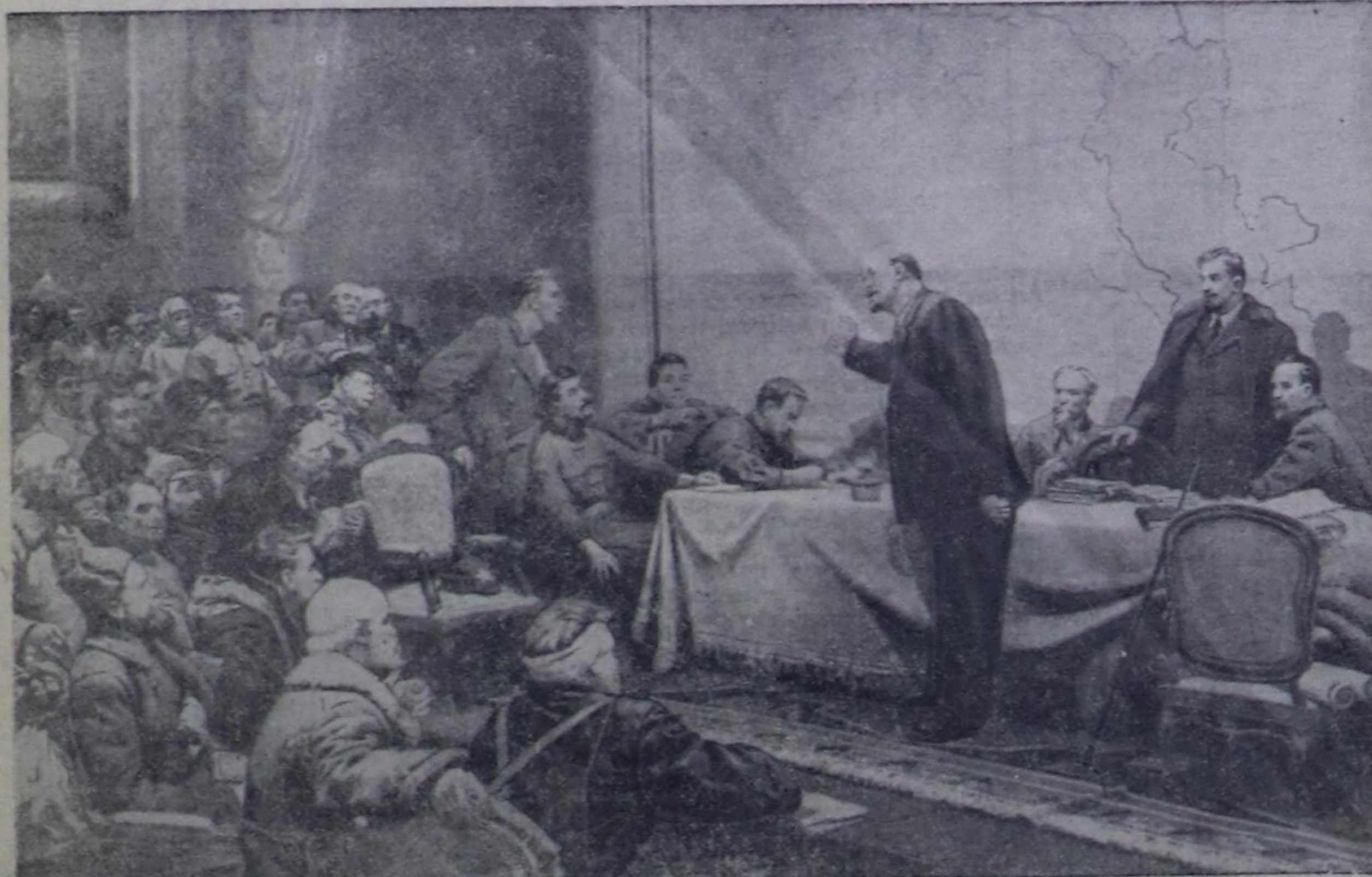
В. И. Лениннің ГОЭЛРО-ның пламның дугайында түзе чугалап турарм.