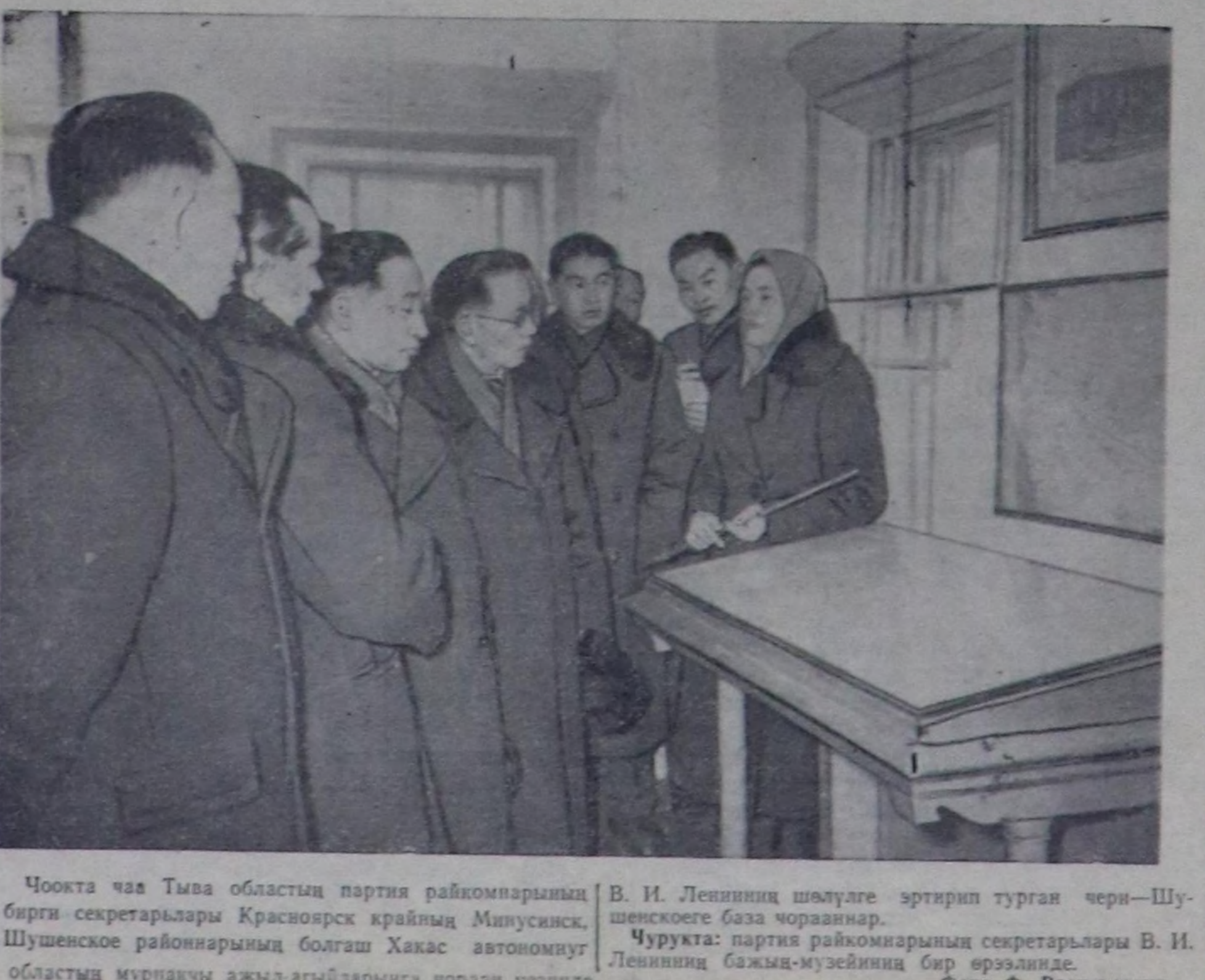
Чоокта чаа Тыва областың партия райкомнарынның бирги секретарылары Красноярск крайнык Минусинск, Шүшеское районнарынның болгаш Хакас автономуг областың мунакчы ажыл-агыйларына чораш үезинде В. И. Ленинниң шөлүлге эртерип турган чери—Шүшеское база чорааннар. Чурукта: партия райкомнарынның секретарылары В. И. Ленинниң бажы-музейиниң бир өрөөлинде.