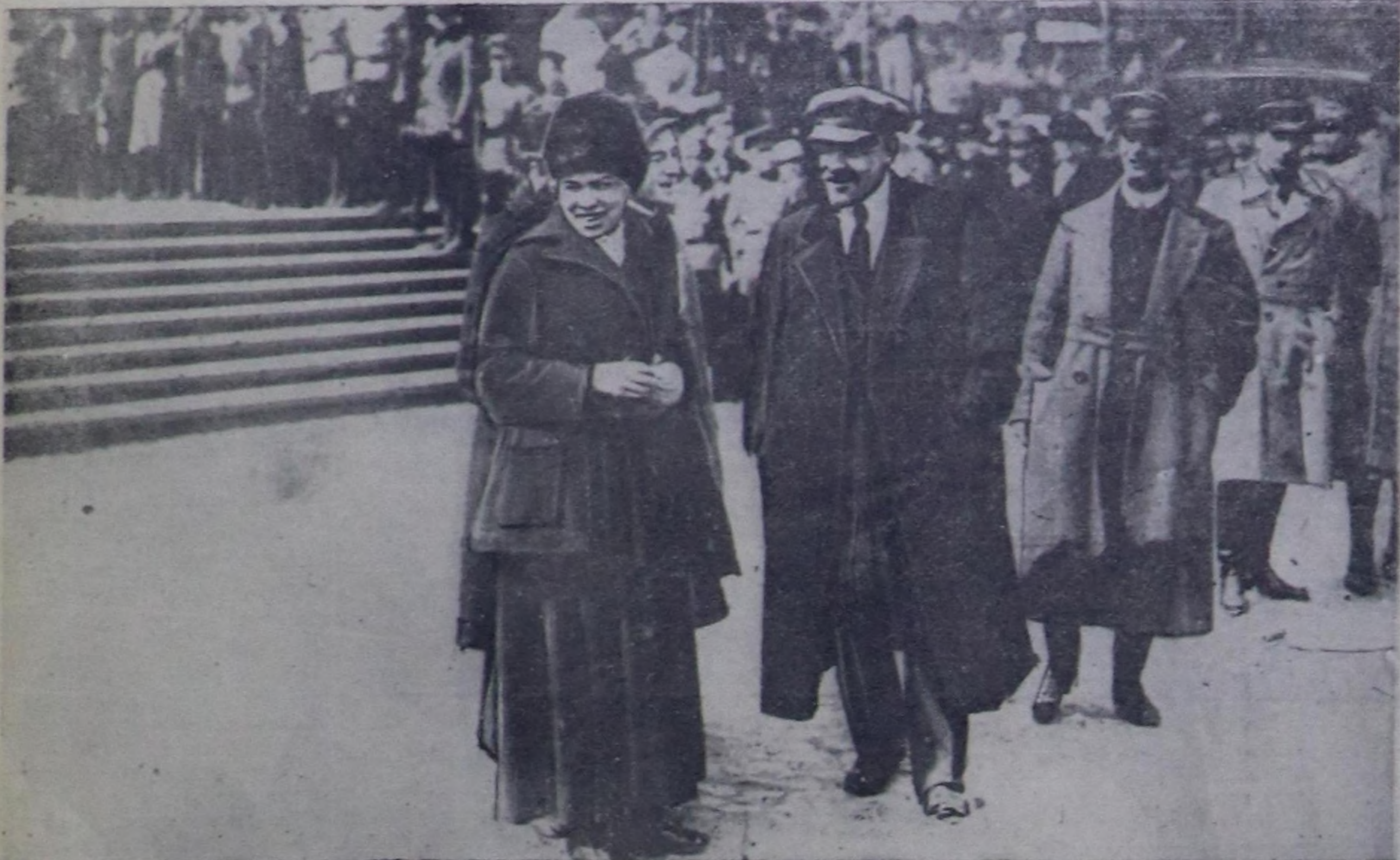
В. И. Ленин дугмаа Мария Ильичична-биле кады 1919 чылдын май 25-те Бугу-интинин шериг өөредилгесинде.