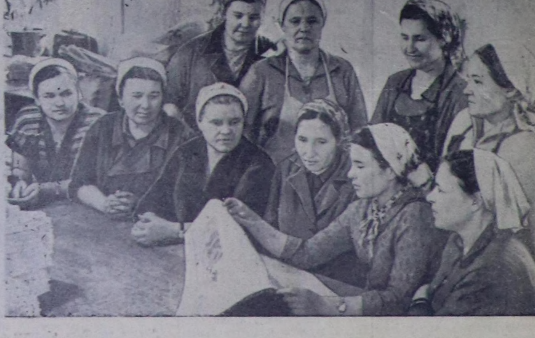
Чурукта: дептерлээр цехтин амылдакчылары Н. С. Хрущевтуң Францига чоразынын түнелдеринч дугайында чөпсөр аразында солундан номчуп турары.