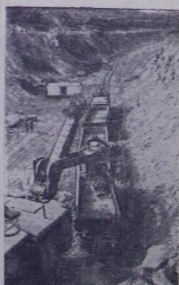
Кривой-Ротун бассейниге руданы шалты чок казар арга чеди чылын дургузула калба-биле илерээр. Аңаа элээн каш руда казар черлерин болгаш оңу болбаарларынны ком-бинаттарын тулуп тургузар.

Чурукта: руданы амьж арга-биле казып ап турары.