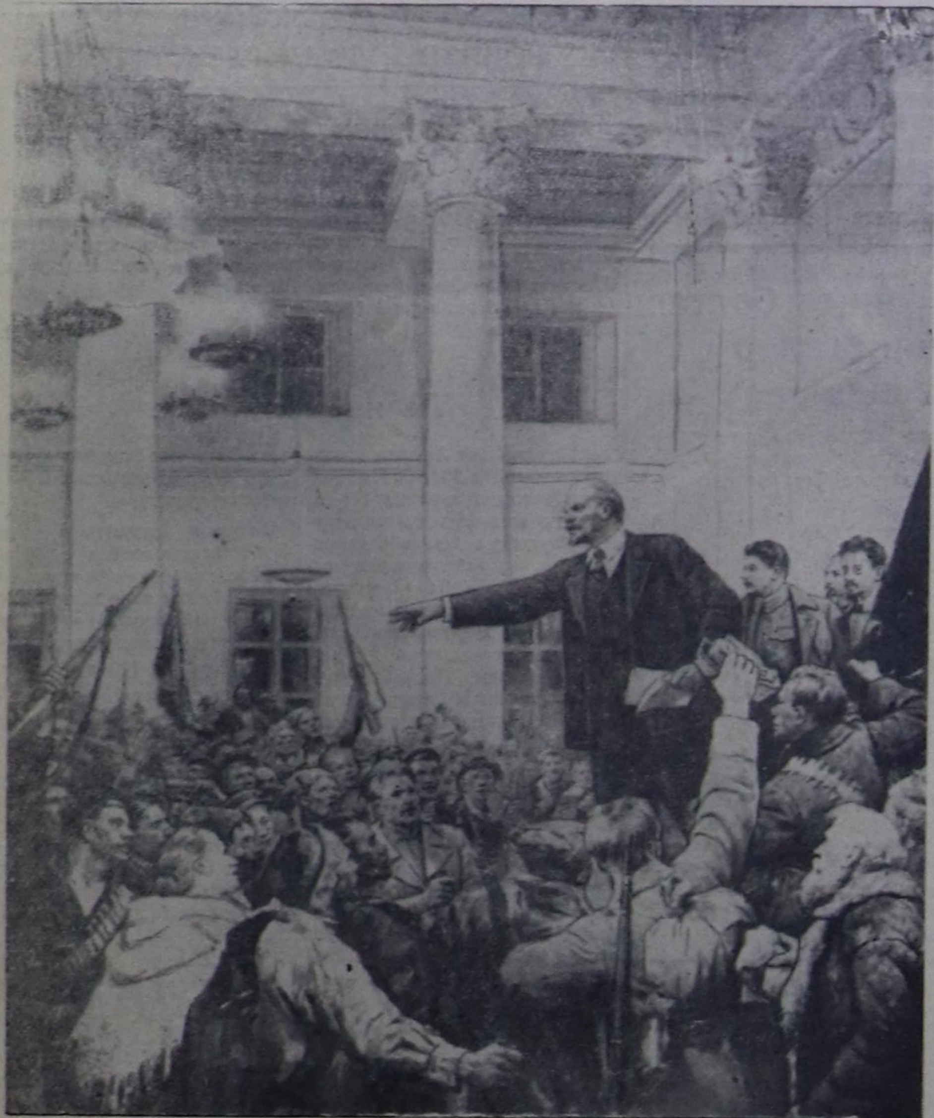
«В. И. Ленин Совет эрге-чагырганы чарлап тур». (В. А. Серовтун чураан чуруундан).