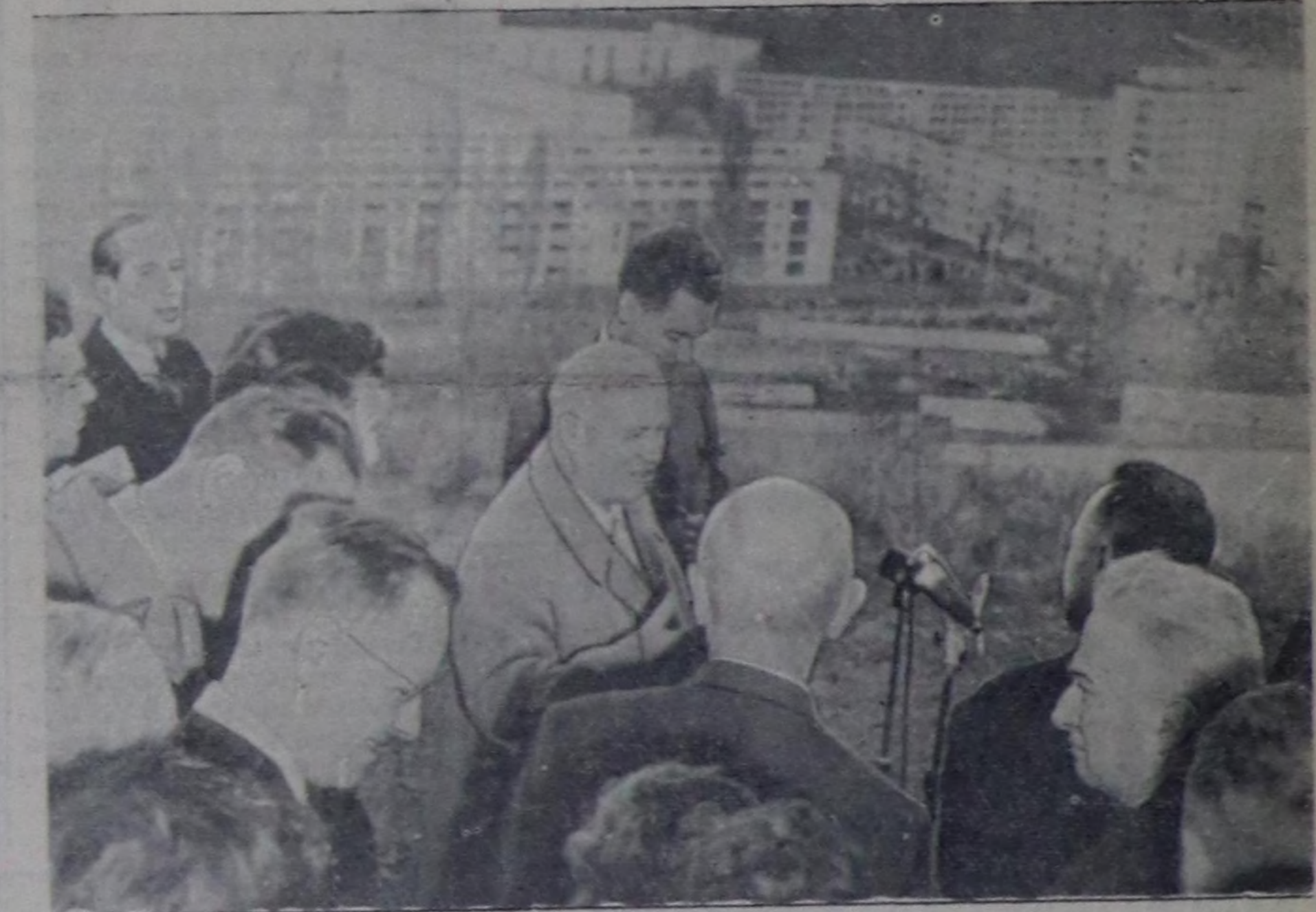
Чурукта: Нефтилик Лакта сөөлү чылдарда тургустунган ажыкчы суурга Совет чазактык баштыкын чүве чугаалап турары.

Ол хүнүн кезээинде ССРЭ-нин Францияга элчини С. А. Виноградов ССРЭ-нің Министрлер Чөвүлелинин Даргазы Н. С. Хрущевтун алдары дөөш улуг хүлөөп азымын тургускан.