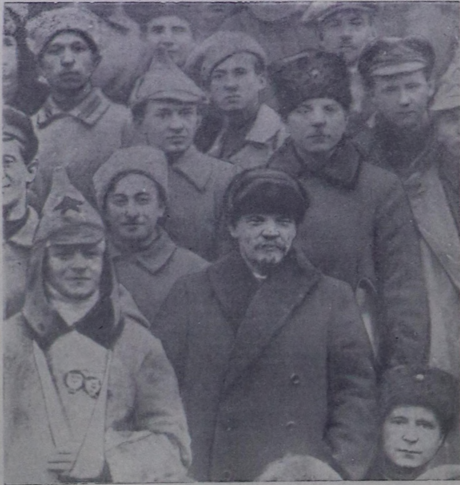
В. И. Ленин биле К. Е. Ворошилов РКП(б)-нин X съездиниң төлөөлериң — Кронштадт үймөүни баскан киржикчелериң аразында. 1921 чылдың март.

Социализмниң тилегиңиз бистиниң улусууска аажок улуг материалдыг хевирлери берген. Бисте национал ортуга амылчы чоннарың эрге-ажыктарына бүрүн-биле хувааттып турар. Чоннуң кижини санагына ошаштыр алмыра революция мурунуга үе-биле дөшкөргө ол 1958 чылда 15 катан өскөн. Совет күрүне улустун културазын көдрөргө.