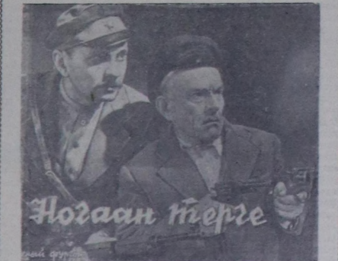
дел кинону көртүр.

Бо кинону А. Козачинскийнин ол-ла ышкан аттыг тоожуундан кылган. Сценарийин Г. Колтунов бижээ. Тургускан режиссеру — Г. Габай Оператору Р. Василевский. Чурукчулары: Б. Карамышев болгаш И. Якушечко.