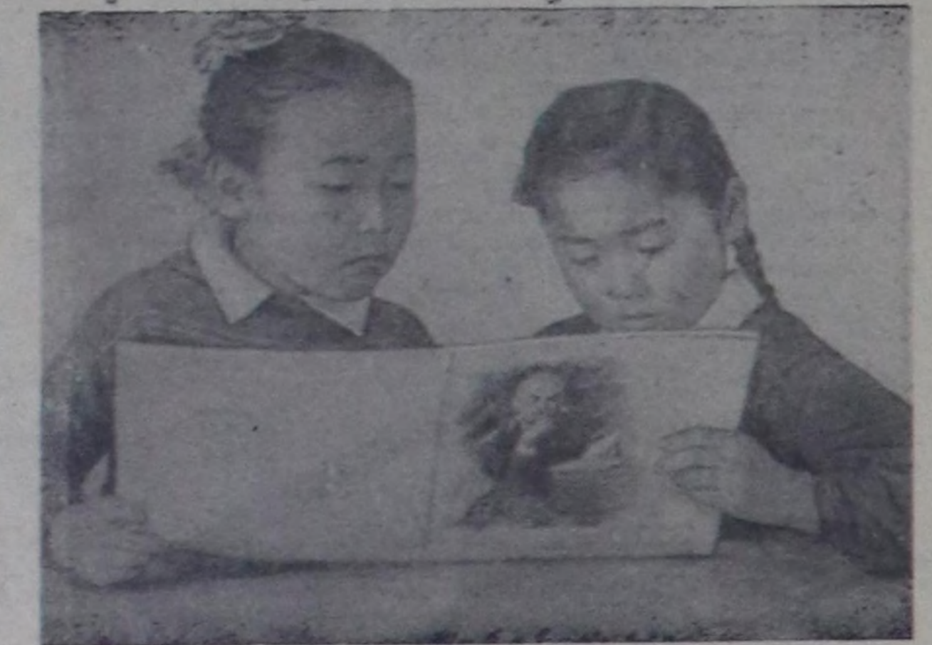
Чөөн-Хемчик районнуң «Хөрүм-Даг» колхозунда школань өөреничлери В. И. Ленинниң төрүттүнгөн хүнүндөн бөөр тозан чыл болурунга утуштур улуг баштычыны бичи чораны-биле, оң амылчы болгаш амылчалды-биле улум ханы тамыжып туралар. Олар Илчичиниң дугайында хөй-хөй солун номнарың номчуп туралар. Чурунта: экижилер Владимир Ильичиниң дугайында солун номчуп олар.