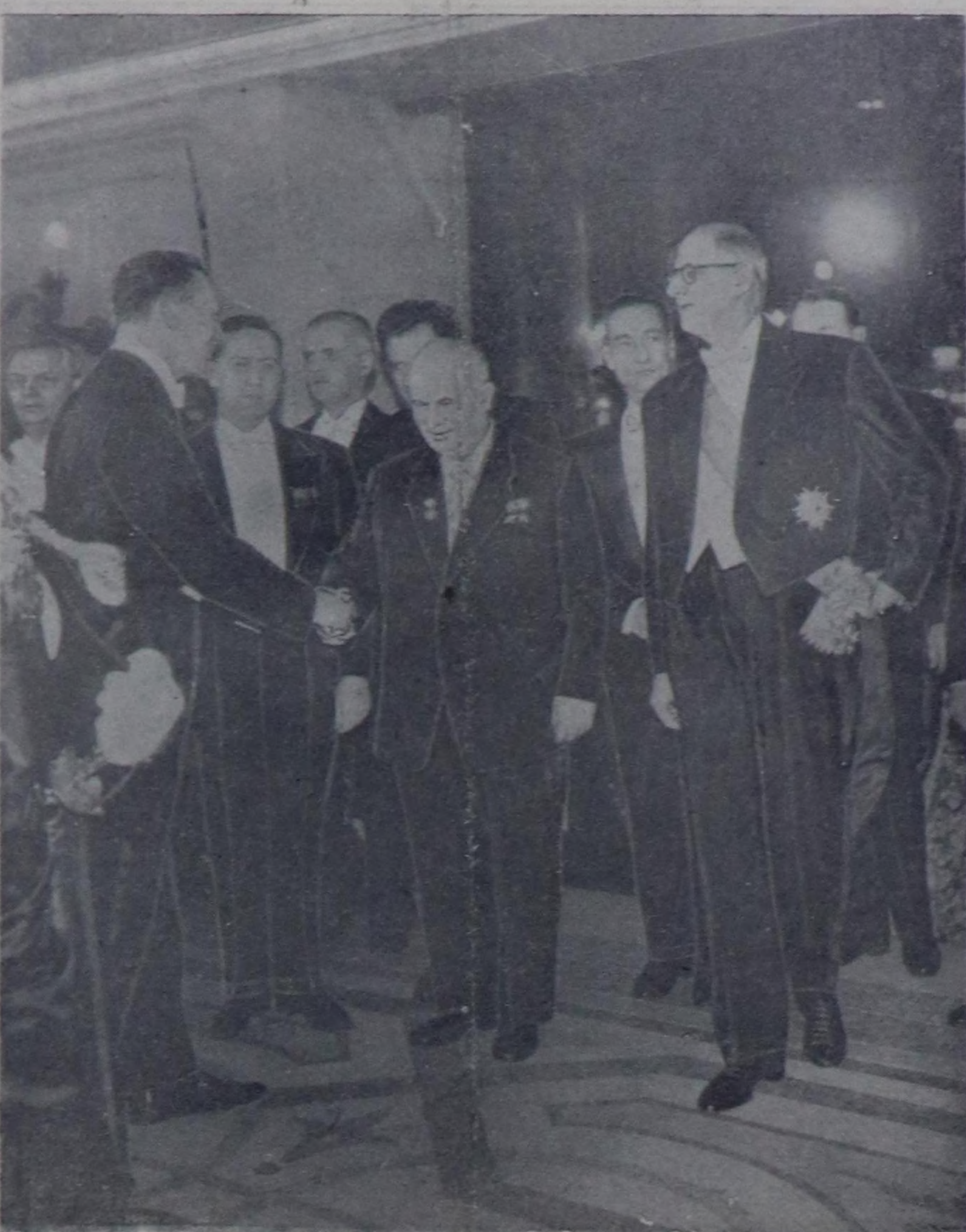
Париж. ССРЭ-ниң Министрлер Чөвүлениниң Дарга-уруу Н. С. Хрущев биле Француз Республикасының Президенти Ш. де Голль Совет чазактың баштыгынын

ЛИЛЛЬ. (СЭТА-ның туснай нор-респондентизи). Март 29-та Н. С. Хрущев болгаш ону үеде чоруп кижилер Лилльде чедергенер. Ук черини-биле 20 шак 41 мину-та президентиниң поездин вок-залга келген. Нор департаментиниң даргазы, хоорайның эрте-чагырганы-ның төлөөлекчилери өңи Хрущевка байыр чедиргенер.