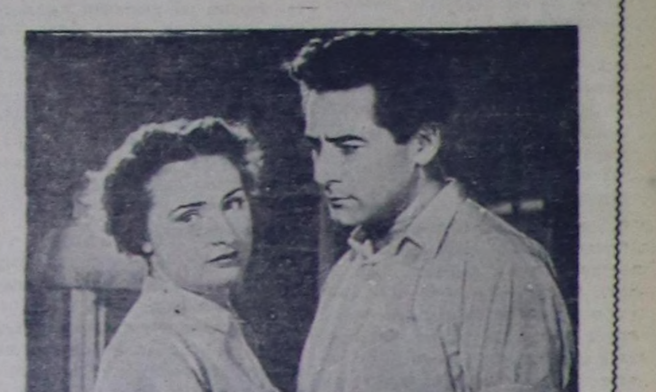
«Баштайгы ынанышылдың ыры» деп кинону көрүнер.