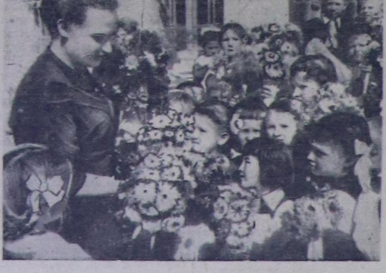
Чурукта: № 7 школаның өөреникчилеринн өөредилге чылымын эгезинде башкылары-биле ужуражып турары.

Келген. Илачтыга Чаазаанын № 1 ортумак школаның чаны онза хайымшыкынн. Ол школага бө өөредилге чылында 420 хире өөреникчилер өөрөспин эгелээн. Школаның дирекция чөри өөреникчилерин хүлөө алырынга эвөсп өөс чүдөдери кылган. Школанын класстарын, интернатты база столовананы чогуур өйдө, көчүгү эки шымарыг кылдыр септөөн. Школанын өөреникчилер боттарынын күжү-биле библиотеканы, спорт шөлүн болгаш еске-даа чүдөдери тудуп алган. Өөредилгени өгөдөөн күнүдө байырым шугум чыскаалын өрттөр-гөн. Анаа школа директору Дөңг-дөй чаа өөредилге чылымын эгелээни холбаштыр школаларга болгаш башкаларга байыр чедирбешан, өөредилгеге баа күш-ажылыч чедиршикнинн бөлүгүн күзөөн. Өөреникчилерин мурундан школа доксомол организастынын секретары М. Кызыл-оол чүве чугаалаш, өзүп оларга анык салгалчылар дугайында партиянын болгаш чазактын уагу сагыш салышкыннын өөрү чөдиргенин илгертей.