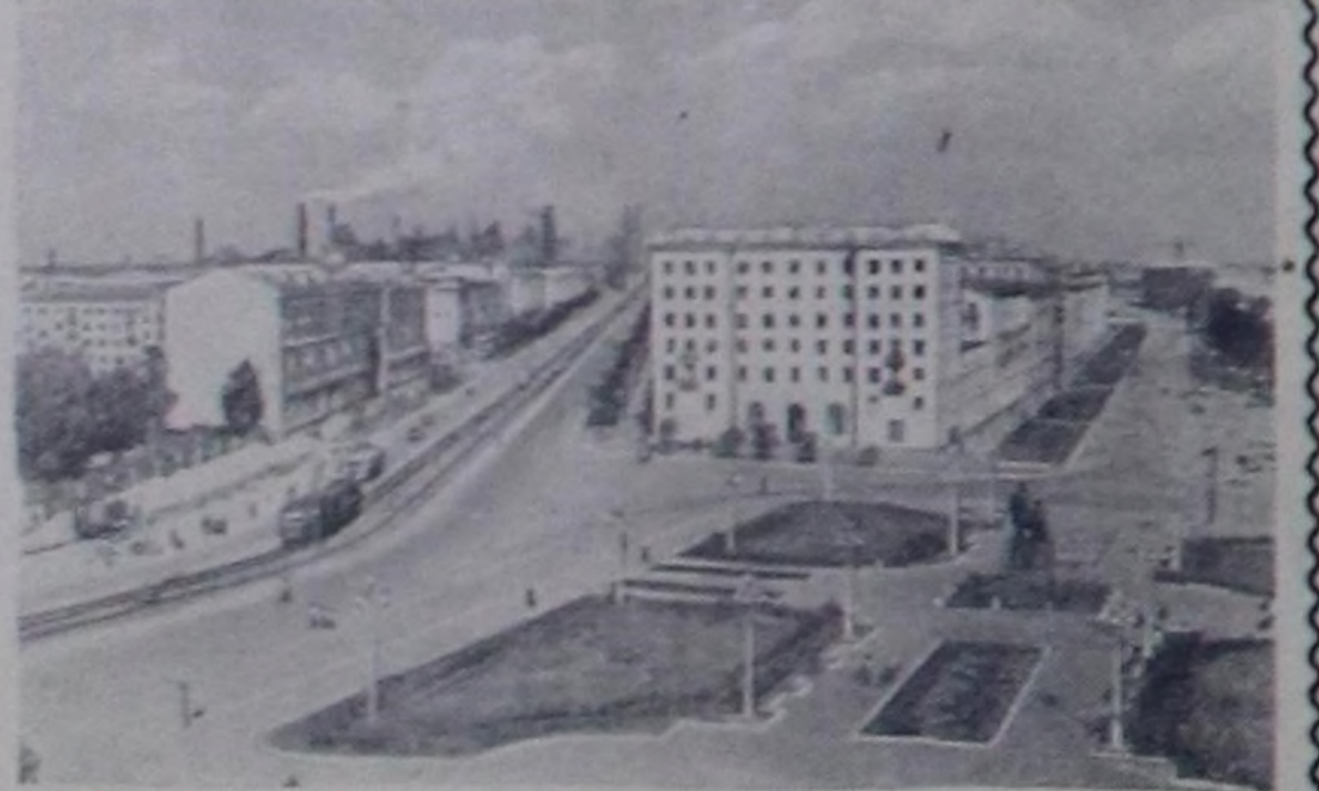
Чурукта: А. Тагале театр шөлү-Ортусунда — «Төрөөн чурт» деп ийн халдыг кинотеатрынн чая ба-жыны.

Свердловск область. Совет эргечтиргенин чыдарынын дургузунда Адам Тагал хоорай таныттымас кылдыр өскерилген.