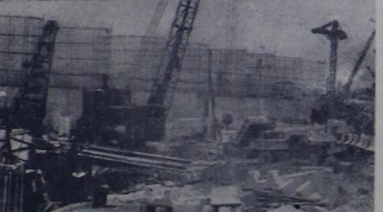
Украинада Кременчук ГЭС-тин туудугжулары баштайгы ийн агрегаттарын айткан хуусазындан эрте ажылгалта кирир деп хүдүзгөзүн чедипкини күссөдир турар.