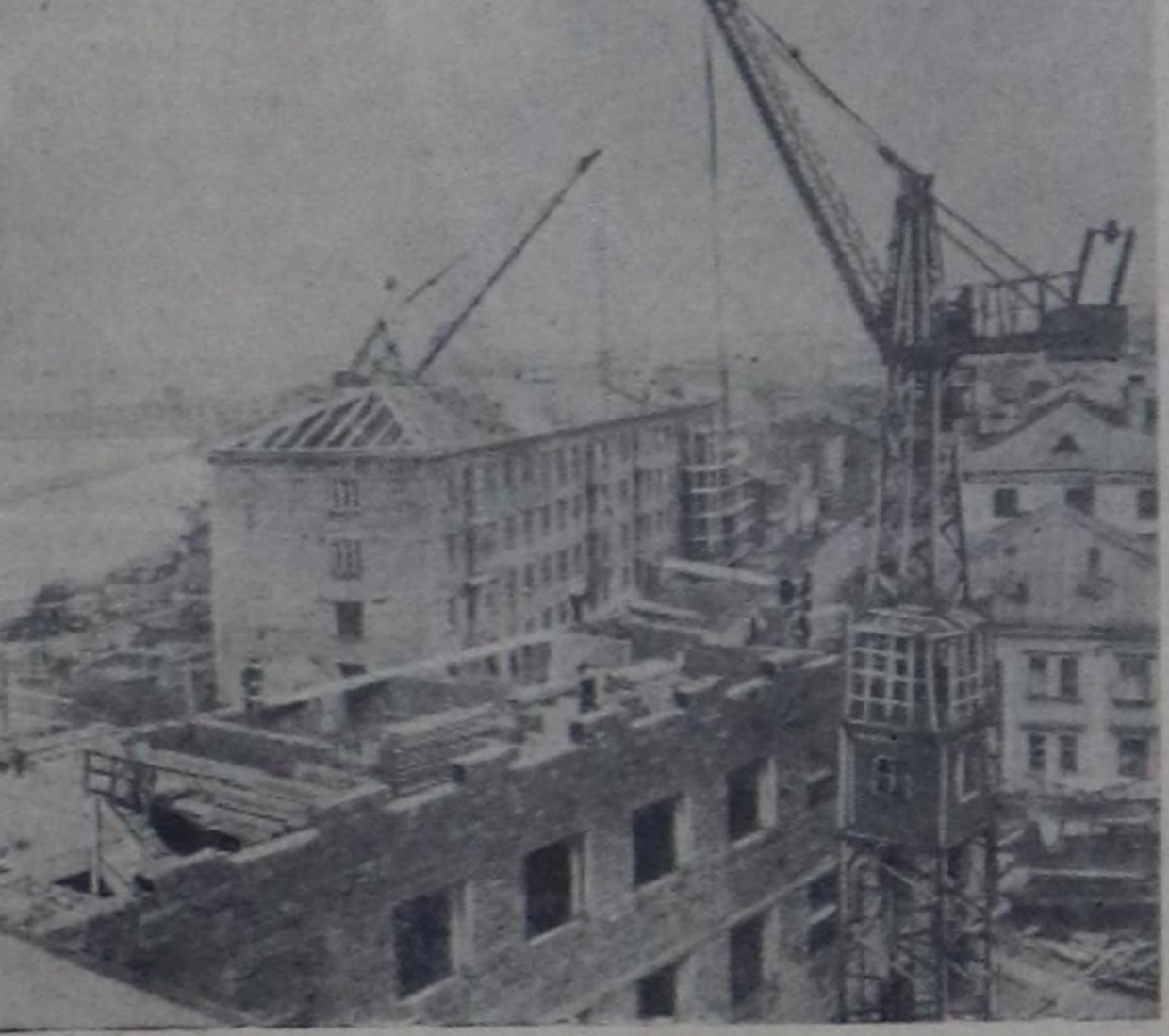
Сахалинның порт хоорайы Холмскада чуртталга бажынарның туудуу калбартып турар. Бу чылын хоорайның чуртталгалары он-он муу дөрбөлчн метр шолдуг чуртталга бажынарнын алдыр.