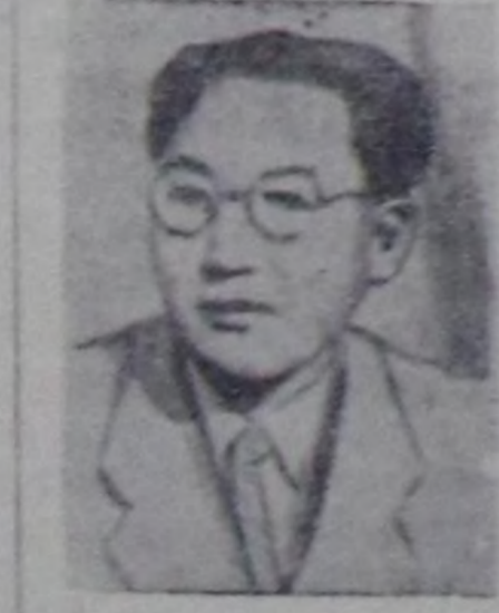
чурттарының парлагачарының дөгөк таңыштарыга кузалаар