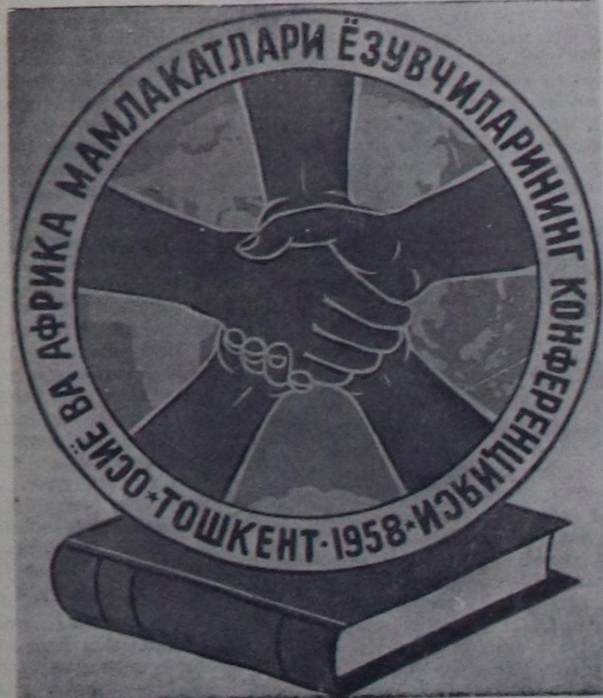
Азия болгаш Африка чурттарының чогаалчыларының конференциязының эмблема дөмбө.