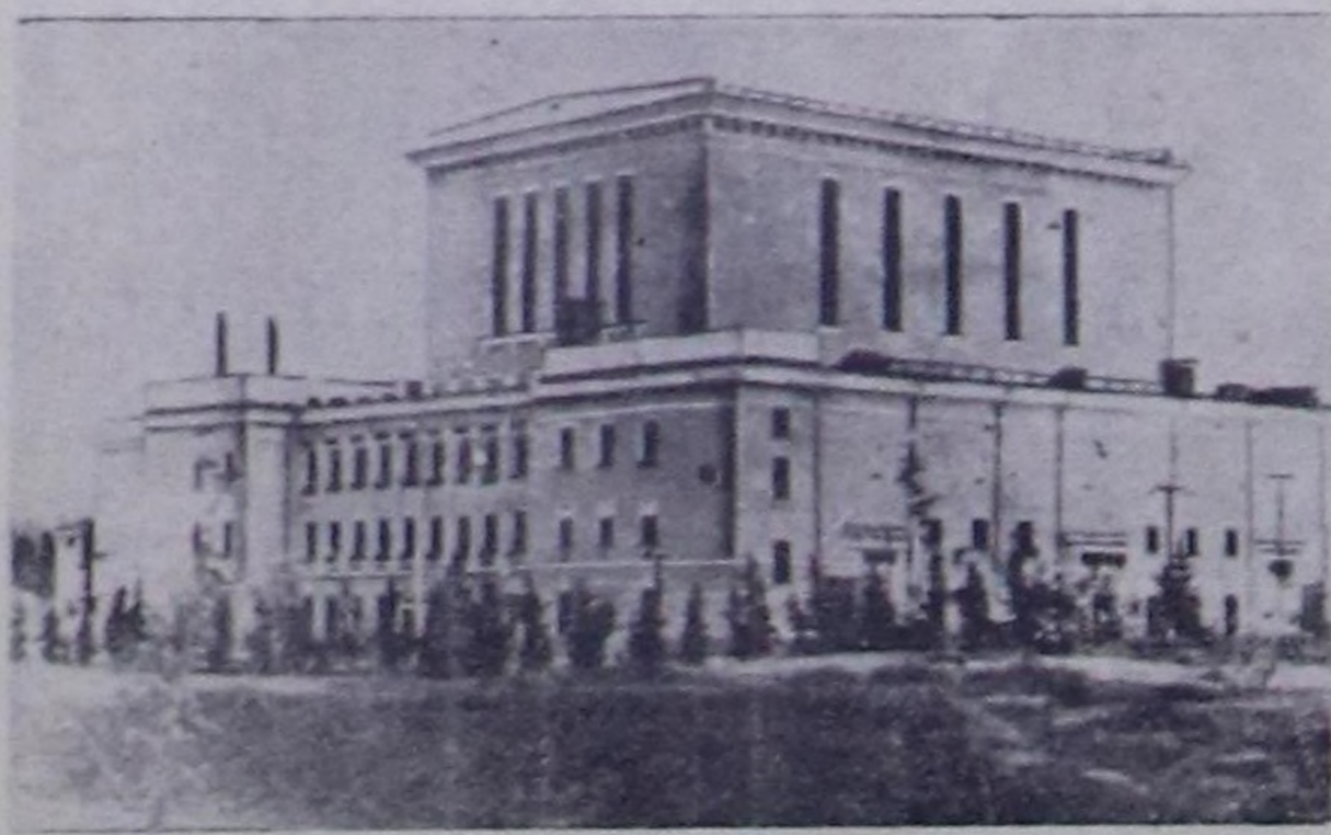
Чоокта чаа алектри күчүзү 100 муң киловатт бөдүр турар атомну алектри станциясынын бирги элгезин ажалгала килгирен. Станциянын долу алектрилик күчүзү 600 муң киловаттка чедирген турат.

Чурукта: 100 муң киловатт күчүзү алектри станциясынын реактору тургускай бажы.