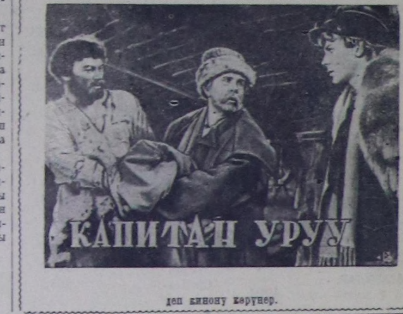
Капитан Уруу деп кинону көрткөн.