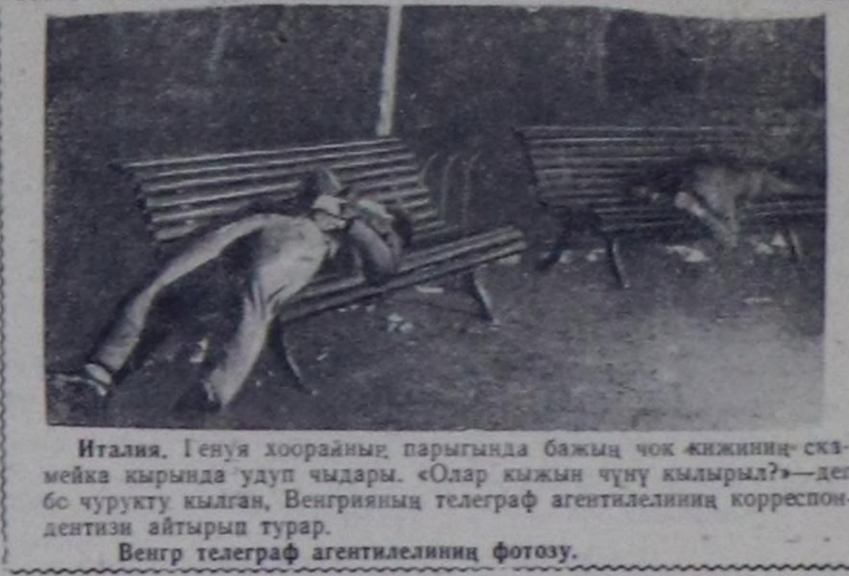
Италия Генау хоорайның паргында бажың чок кижиниң скамька кырында уду чыдар. «Олар кижин чүчү кылдыр!» — деп бо чорукту кылган, Венгрияның телеграф агентелиниң корреспондентин айтырып турар.

ПАРИЖ. (СЭТА). Алжирде чазакта уду демисели организастар дөш колонизаторжу идегелтерин оралдыжышкыны оларын шериг өрге-чыгаргалару детки-өөшкөн октябрь 16-да чөдүмчө чок доозулганы парлага мынадылгарында өскүчү турар. Айтылган хуусага чедир бүтүн чартык шак мунунада генералар Садам болгаш Маюсу олар биле чугаалажышкына чорутуп турган «Хей ниити камгаланың комитетини» амыдыралык боттарың чарлааны ажыл сосо-дынышкыны күш чок болдура ужурга таварышкан. Форум шөлтө оларын кылмы дөш чысаалы база болбаан, аназ чүтө 50 кире кижэ чыгым алган турда оларын каргыс шагдаалар тарады ойда-лыганы.