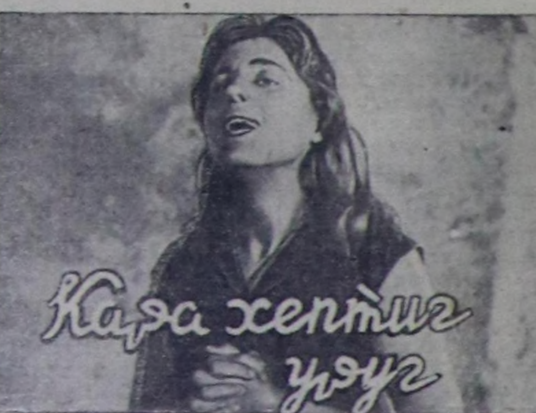
«Кара хептиң үзүң» деп кинону көртүр.