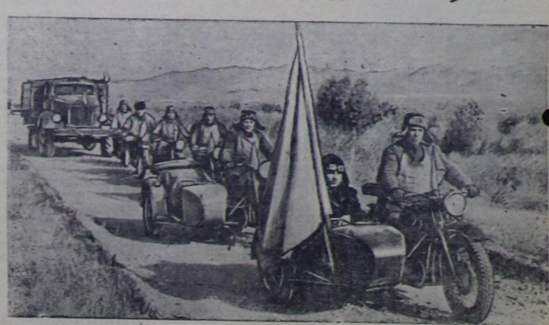
ВЛКСМ өбөмү болгаш ДОСААФ-тын хоорай комитетинин Ленинчи комсомолдун 40 чыл оюнга алдаржыткан мотоциклчилерин дүрген чорур походу оңганда. Оң маршруу: Кызыл—Шагаан-Арык—Чазана—Суг-Асы—Хандагайты—Эрзин—Саагаалдай—Балгазын—Бай-Хаак—Хову-Аксы—Кызыл. Мотоциклчилериниң маршрууну ДОСААФ-тын хоорай