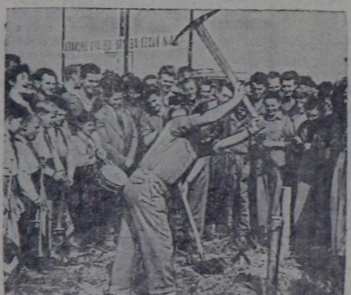
Чехословак аныктар өвилелинд кижигүнери Остраванын хөмүр даш бассейниде чаа шахтаның туудуна иренпейлг кирип турар. Чаа шахта 1964 чылда хонута 1000 тонна хөмүр дашты, а 1972 чылда 5.000 муң тонна чедир хөмүр дашты бээр болур. Шахта туудуунуң ажилын сентябрь 1-де байырладым-биле өткөзөн.