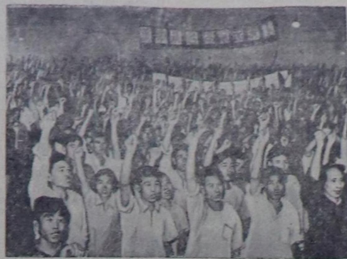
Кыдат Улус Республикасы, Пекинниң чогуунда Шиндзиньшаньнын металлургия заводунун ажилчылары, инженер-техниктер ажилдакчылары Тайвань өскүдө байл дугайында КНР-нун Күрүне чөвүделенин премьер Чжоу Энь-лайнын медегелени деген, митингилери, чыскааларын өрттирген.